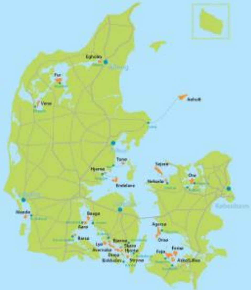
Sammenslutningen af Danske Småøer