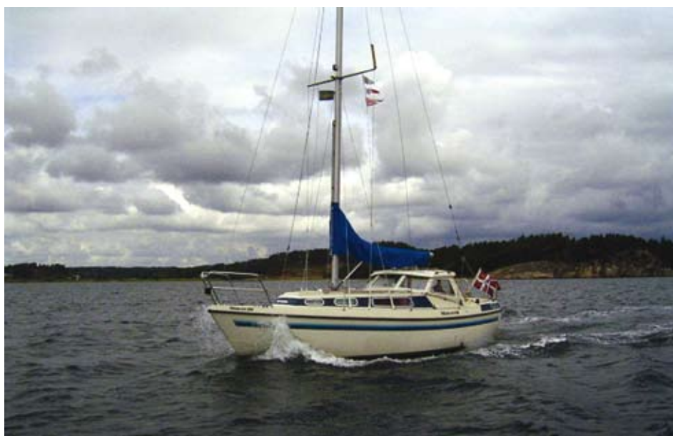
De danske småøer populære mål for såvel danske som udenlandske lystsejlere

af Danske Småøer“ – det er jo kun 25 i egen båd – har det gode skib ”Scorpio” af Næstved, som vores Mascot 28 hedder, også besøgt andre småøer, og i flæng kan bare nævnes Livø, Vejrø, Nyord, og Vejlø (Nakskov Fjord).