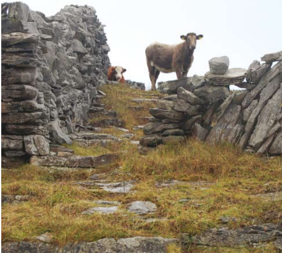
På de vindomblæste irske øer i Atlanterhavet er energi-selvforsyning et tema, der står højt på dagsordenen

I løbet af den næste måned sender vi invitation ud til foreninger på de 27 øer. Meningen er så, at beboerforeninger o.a. kan søge om at få deres energi-grupper med i projektet. Inden juli vælger vi de tre øer, som skal være med i projektet, så