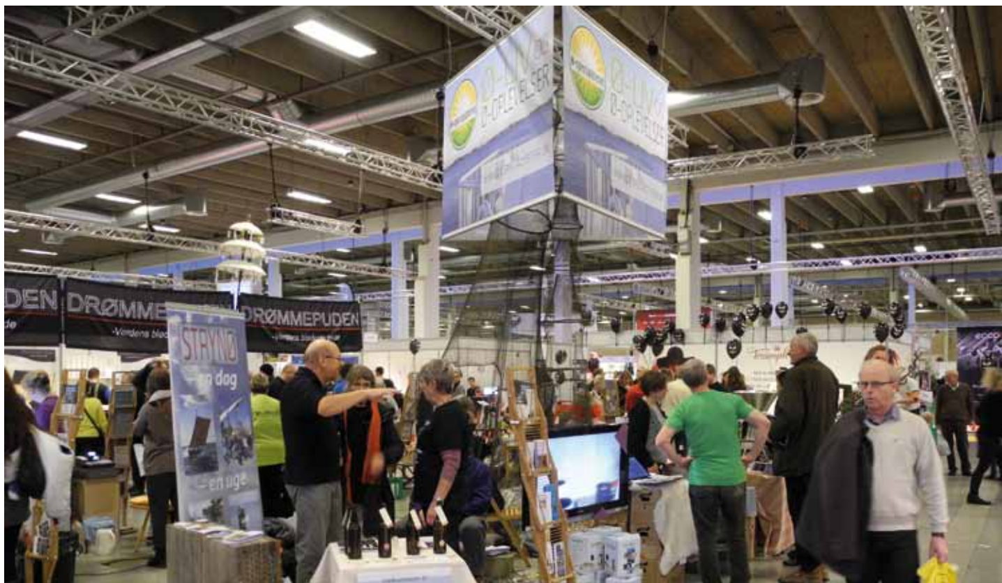
Småøernes Fødevarer-netværk havde en stor, flot stand på messen i Bella Centeret

42.072 personer gæstede ferie- og fritidsmessen i Bella Centeret i januar. Det var 3000 færre end sidste år, til gengæld meldte flere udstillere om bedre salg. Sammenslutningen af Danske Småøer havde fået til huse på fødevarer-netværkets stand. Standen var meget fint opbygget med ruser og net fæstnet i loftet som