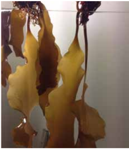
Sukkertang i tørrerum