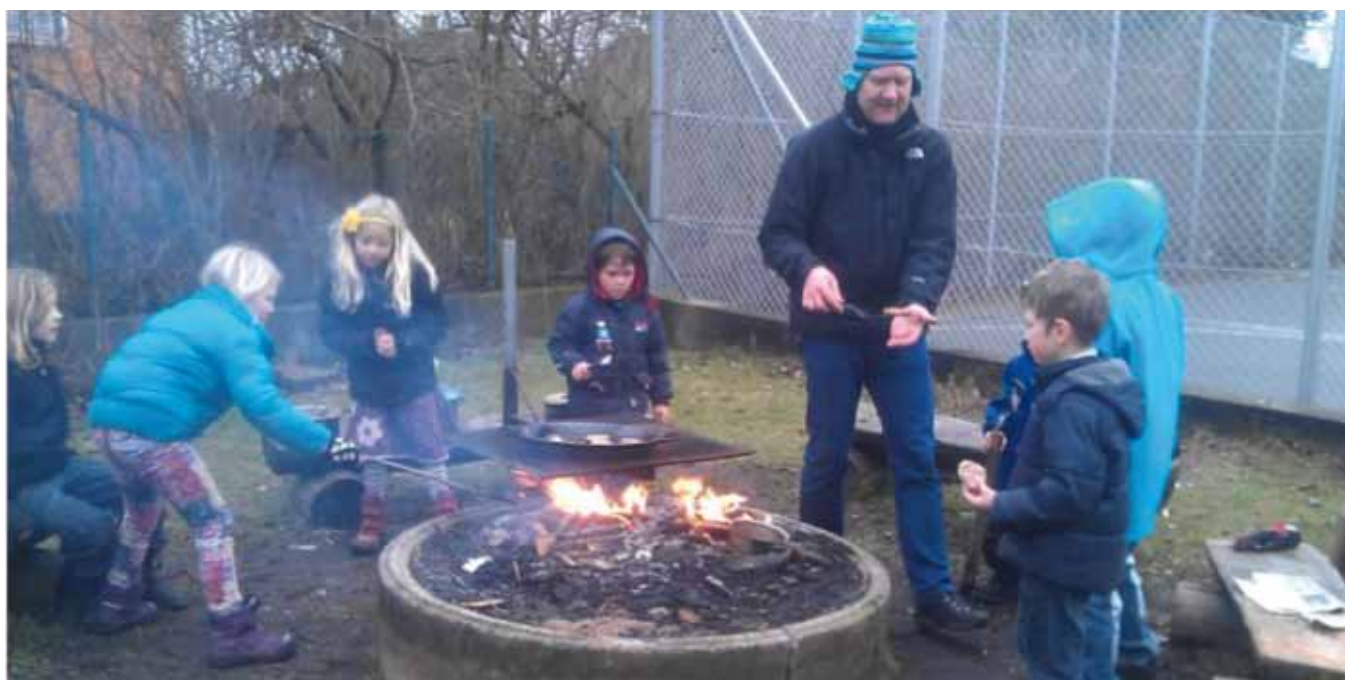
Anholt Børnehave i gang med at bage vikingbrød på bål