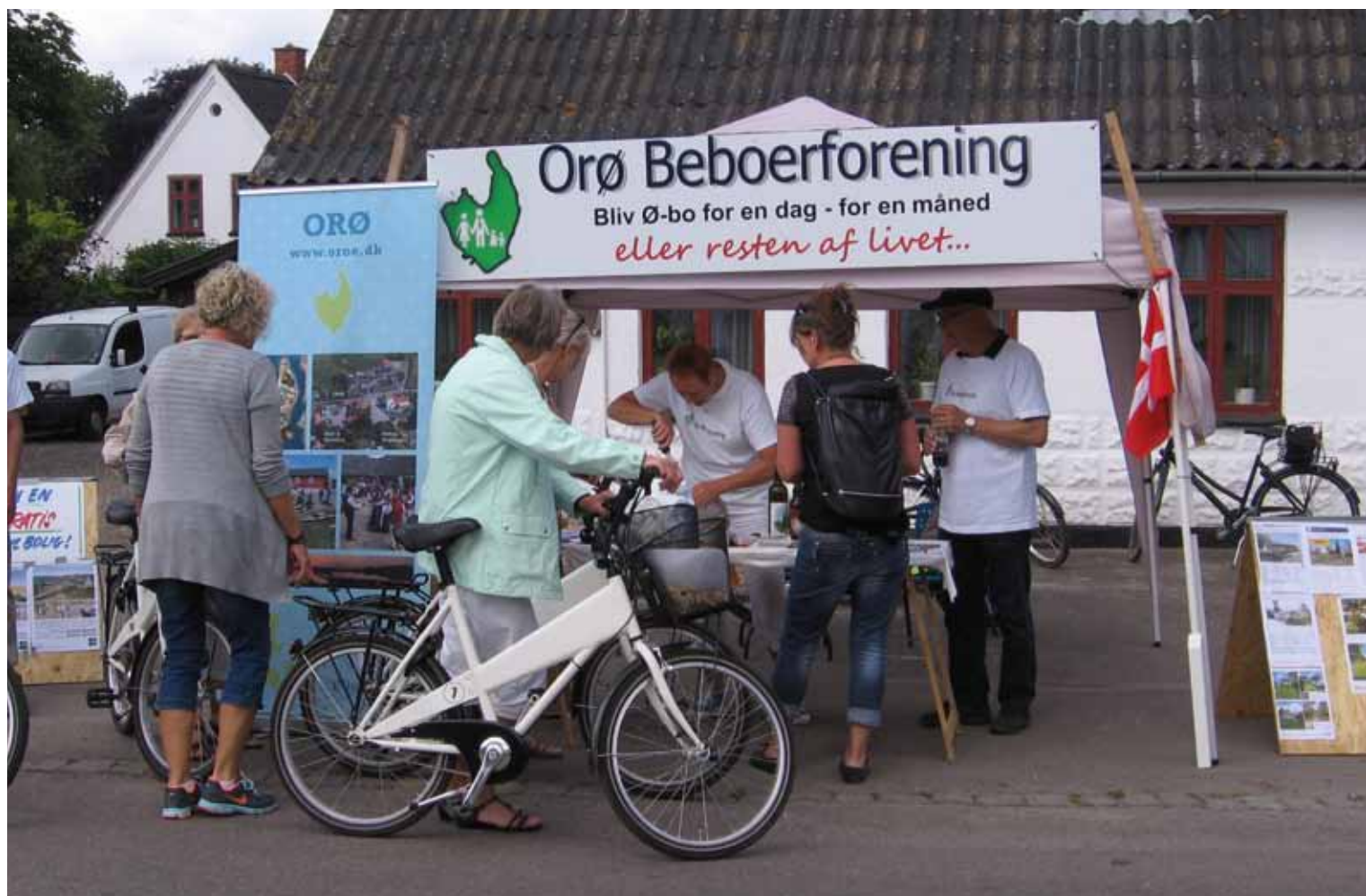
Orø Beboerforenings „Bliv Ø-bo kampagne“

Orø har igennem det sidste år oplevet en stor befolkningstilvækst. Orø Beboerforening overvejer her hvad årsagerne kan være.