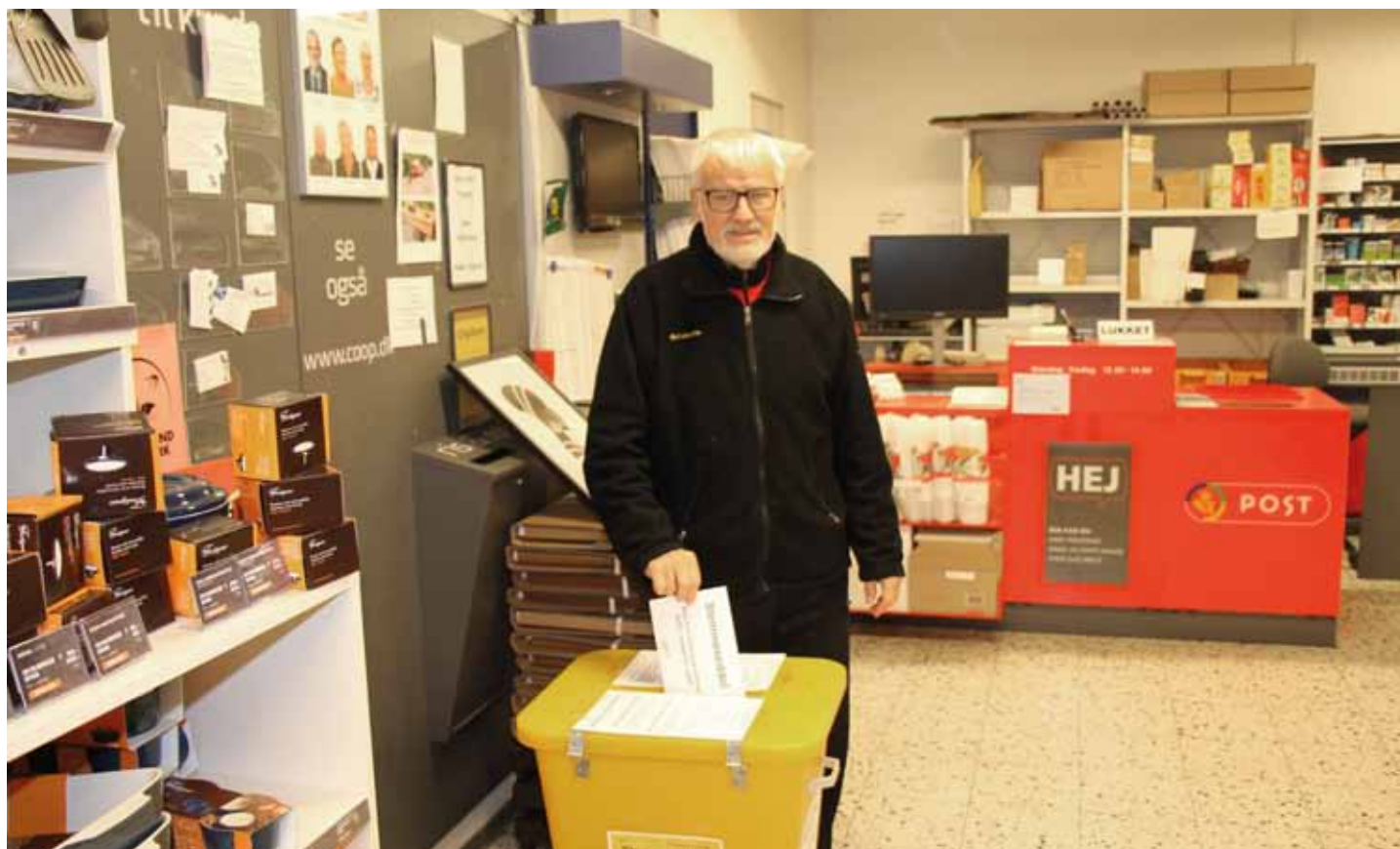
Stemmeboksen har været opstillet i den lokale brugs på Orø i to uger

Fjorten dage i januar kunne beboere og virksomheder på Orø aflevere deres stemmeseddel i en dertil indrettet boks opstillet i Dagli'Brugsen.