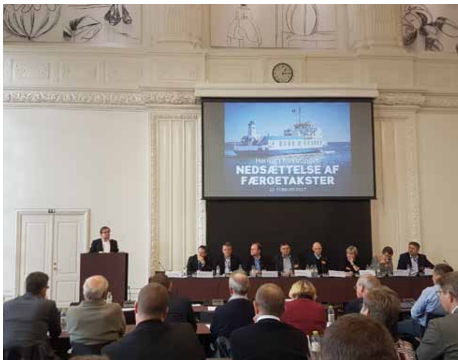
Indenrigs- og økonomiministeren holdt det første oplæg ved høring om nedsættelse af færgetakster i Landstingssalen

Ønsket fra dagen blev derfor, at man fra Folketingets side går i gang med at