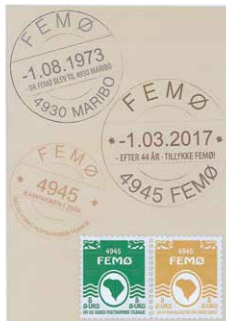
På Femø har man længe ønsket sig det gamle postnummer tilbage

Femø har været den hurtigste – her har man i en årrække ønsket sig det gamle postnummer tilbage og har siden 2008 arbejdet for sagen. Afstemningen blev holdt i december, og sagen har været gennem Postnord og Trafikstyrelsen til godkendelse. Nu sker det så: den 1. marts træder postnummeret 4945 Femø i kraft – og nyheden om Femøs postnummer er endda blevet bragt i den engelsksprogede, kinesiske avis Global Times!