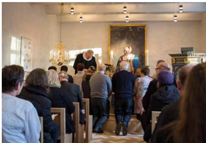
Venø blev genindviet i december 2016

Det er stadigvæk muligt at tilmelde sig seminaret ved henvendelse til sekretariatet ap@danske-smaaoer.dk . Seminaret koster pr. deltager 625,- kr., der dækker måltiderne (ekskl. drikkevarer), men ikke transport til og fra Venø. Program og praktiske oplysninger findes på www.danske-smaaoer.dk .