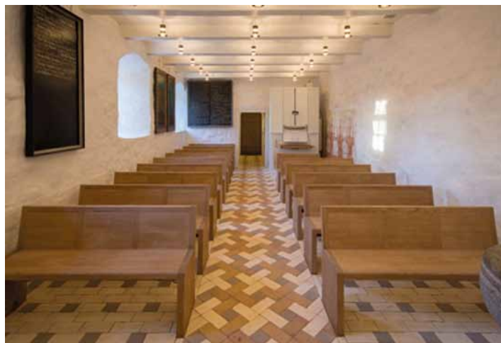
Det 'nye' kirkerum efter 9 måneders istandsættelse