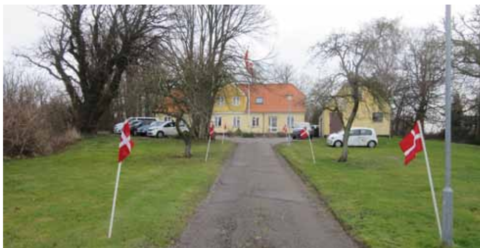
Femøs nye postnummer blev fejret med reception i præstegården