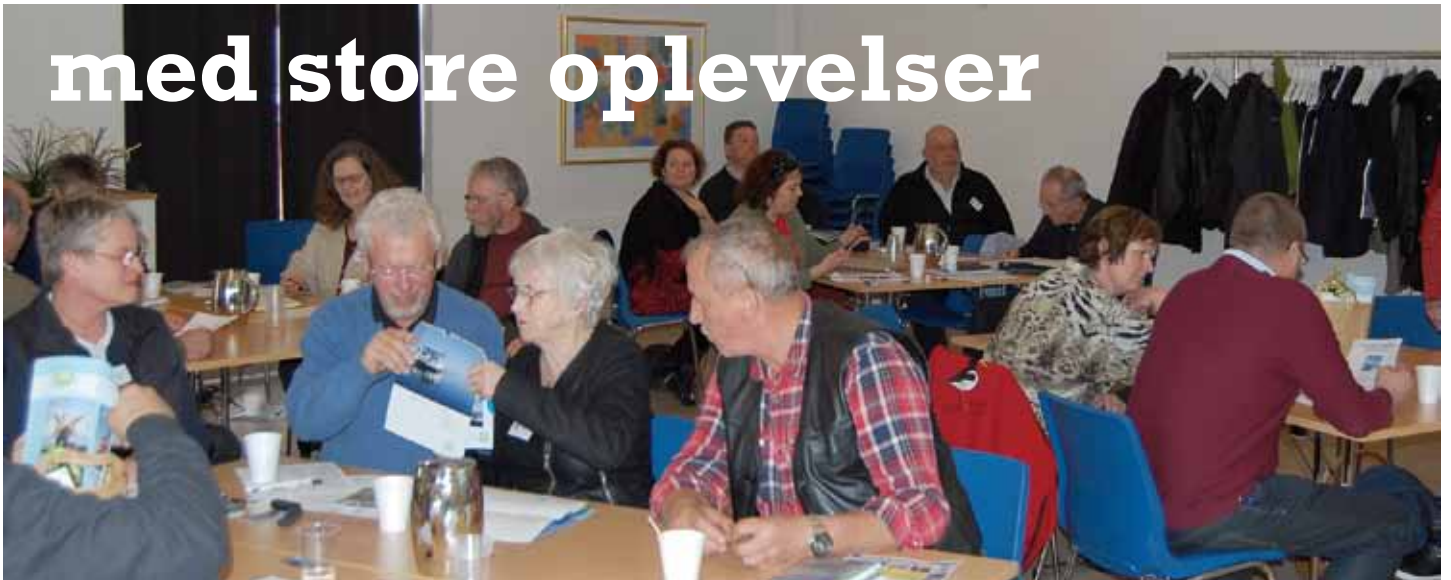
Turistaktører fra 12 småøer mødtes til seminar i marts måned i Odense

dem til at besøge Endelave i 2015 sammen med deres foreningsmedlemmer. I 2015 inviteres der på en produktkendskabstur for frontpersonalet fra fastlandet.