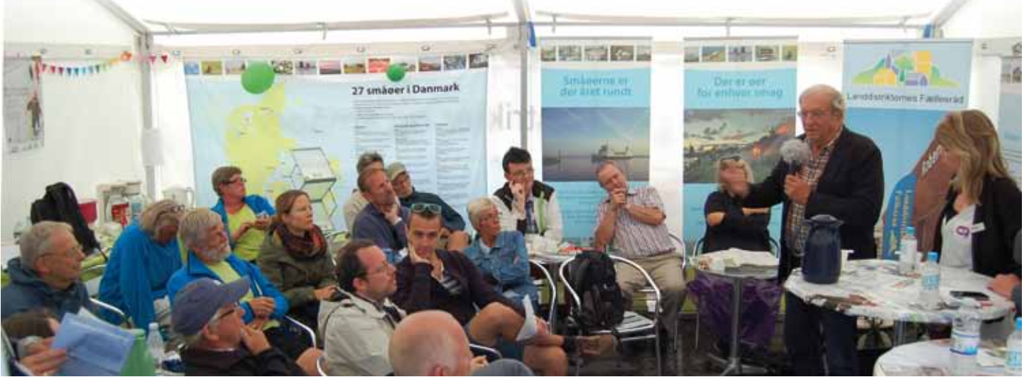
Fredagen bød på debatten „Jamen, I har jo selv valgt at bo dér“ – en debat om rammebetingelser og rimelighed

I midten af juni stod Allinge på „storebror“-øen Bornholm på den anden ende: Folkemødet var i gang for fjerde år i træk.