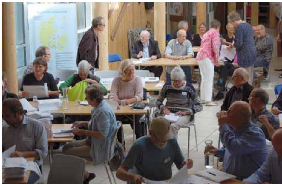
Generalforsamling i salen på Øhavets Smakkecenter på Strynø

Selve generalforsamlingen i Sammenslutningen af Danske Småøer indeholdt beretning fra formanden og flere indkomne forslag.