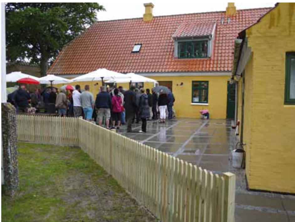
Trods silende regn var der stort fremmøde til en festlig indvielse af Lyø Kultur- og Besøgscenter

Tilflytterlejligheden er allerede udlejet og caféen er åbnet med en ny forpagter, der ved indvielsen bød på dejlige smagsprøver fra køkkenet. Så til sommer vil turister på Lyø kunne få stillet sult og tørst i de smukke omgivelser.