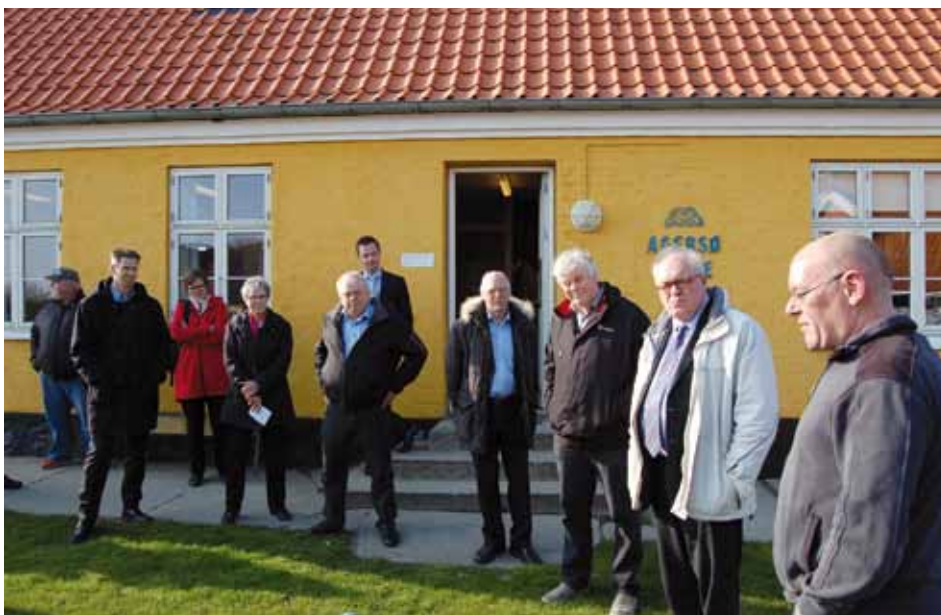
Udvalgets medlemmer og de øvrige besøgende foran Agersø skole

Derefter havde Udvalget inviteret beboerforeningens bestyrelse og Ø-udvalget til middag og her var god