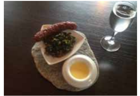
Signatur-retten fra Årø består af hjemmelavet pølse af kød fra Årø Galloway med rapssalsa og sennepsdip serveret med et glas tangvin fra Årø vingård.

Årø har fået sin helt egen lokale pølse og signaturret.