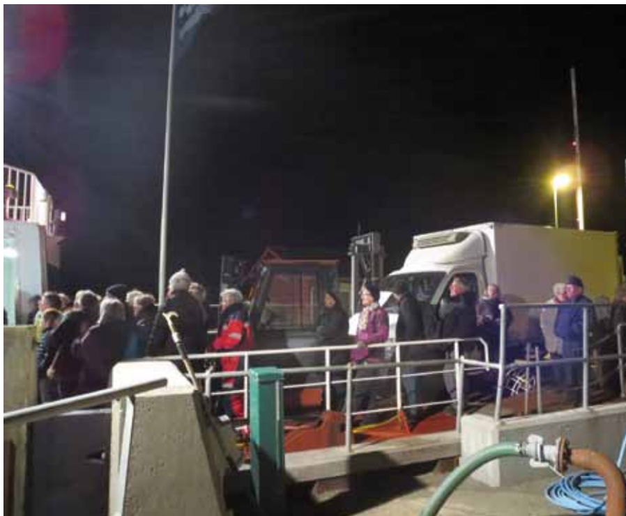
Omøboere „satte sig” på den sidste aftenfærge fra Omø tirsdag den 1. april.

75 øboere valgte derfor tirsdag den 1. april kl. 22 at markere deres util-