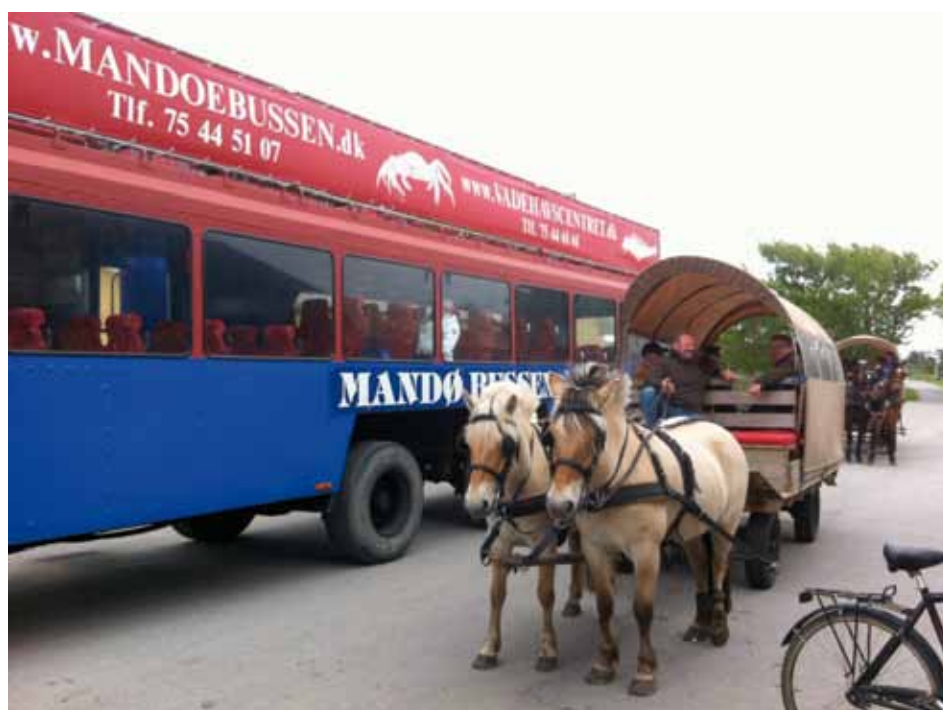
Ca. 45 personer deltog i produktkendskabsturen til Mandø i april

På Endelave har jeg holdt to møder med turistvirksomhederne. Med en god portion entusiasme og samarbejdsvilje arbejdes der nu på at lave tilbud til seniorer, altså 50+. Derudover er det besluttet, at der for foreningsformænd på fastlandet laves en tur til Endelave i sensommeren 2014. Formålet med denne tur er at få