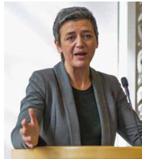
Indenrigs- og Økonomiminister Margrethe Vestager

Høringen afsluttedes i anledning af Ø-sammenslutningens 40 års-jubilæum med en tale af formand for Folketinget, Mogens Lykketoft, og en efterfølgende festlig reception med lækkerier fra småøerne. Tusind tak til Fur Bryghus, Strynøfrugthave, Årø Vingård for øl,