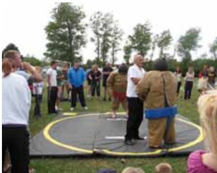
„Spil uden grænser“ på Sejerø i 2008

at deltagerne ankommer fredag eftermiddag, opsætter telt, deltager i fælles spisning og festivitas om aftenen. Lørdag går det efter den fælles morgenmad løs på sportsarenaen, hvor der dystes på kryds og tværs hele dagen. Kan man som ø