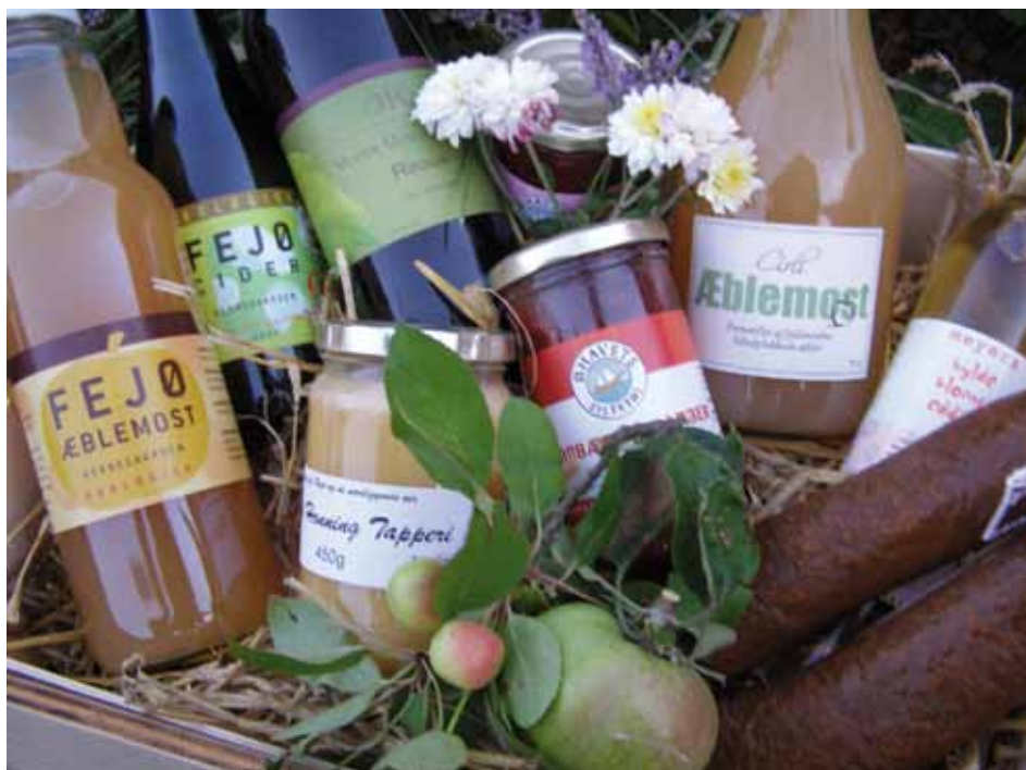
Kvalitetsfødevarer fra småøerne

Ø-specialiteter® er ikke blot et påfund for at skaffe opmærksomhed i salgsojemed. Mærkningens formål er at forbedre forudsætningerne for udvikling og produktion af en særlig kvalitet, der knytter sig