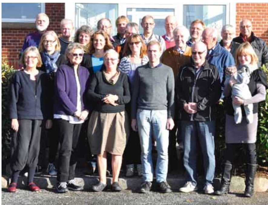
Oboere fra Hjørnø, Sejerø og Orø mødtes i september 2012 til det første seminar i ØSE-projektet. Det skete på Thaisen Hus på Midtfyn.

I februar var der borgermøder på Sejerø og Orø om ØSE-projektet, og