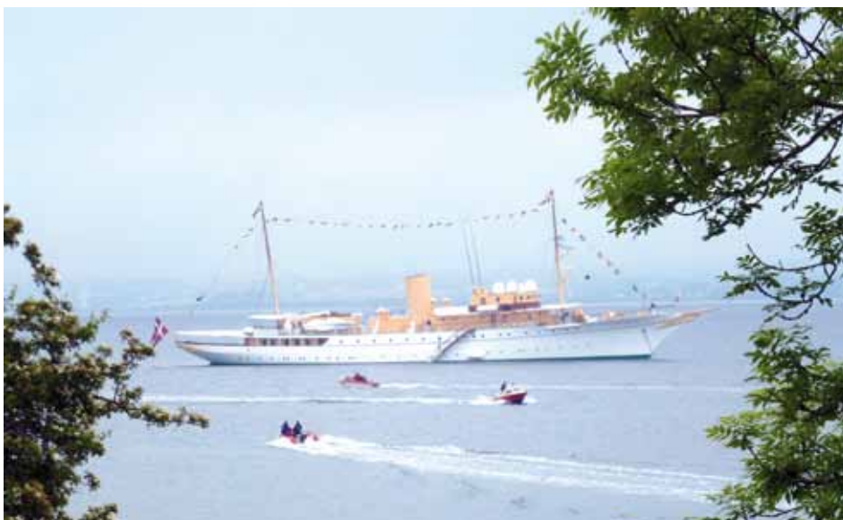
Kongeskibet Dannebrog på togt mellem småøerne