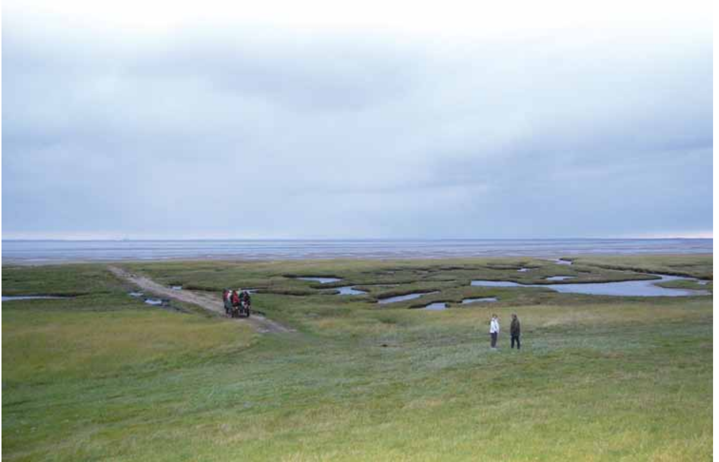
Udsigt over Mandø og Vadehavet