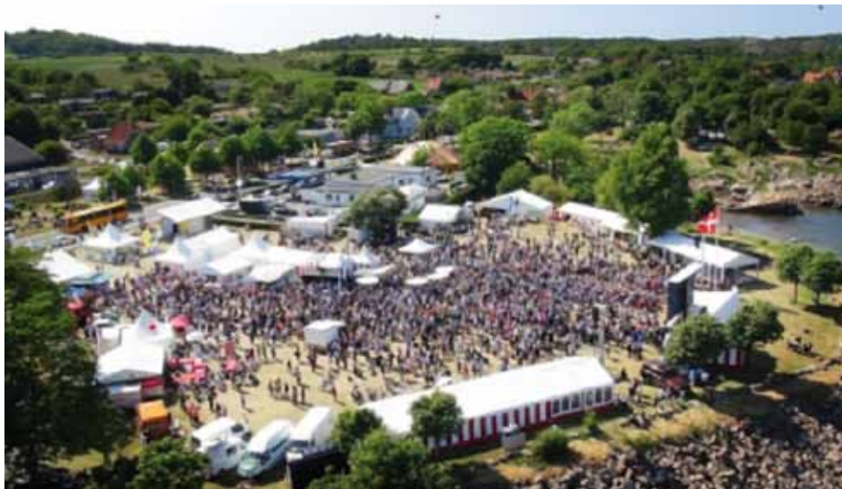
Folkemødet i Allinge på Bornholm i 2012

Sammenslutningen af Danske Småøer vil være til stede med sin egen stand på Folkemødet 2013, der afholdes i dagene fra den 13. til den 16. juni i Allinge på Bornholm. Det er 3. gang denne politiske festival afholdes, og det forventes, at der i år vil komme endnu flere end de 32.000, der sidste år gæstede Folkemødet.