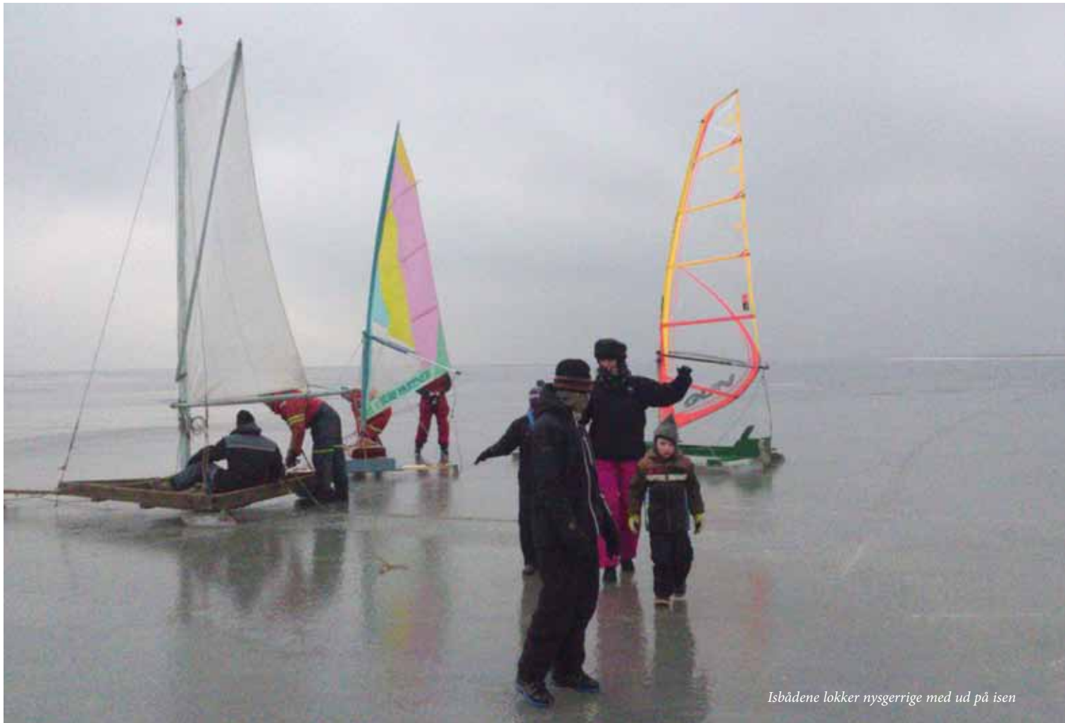
Isbådene lokker nysgerrige med ud på isen

Isen har altid opildnet til hittepå-somhed hos øboerne. Isbåde er blot én af mange løsninger for at krydse det stivnede hav. I gamle dage af praktiske årsager – i dag for sjov.