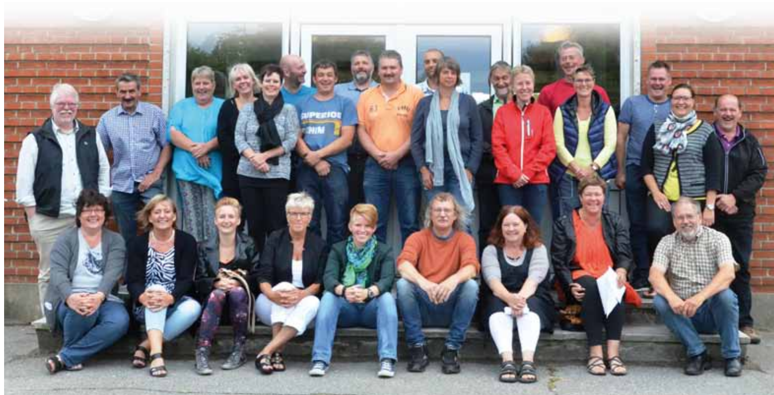
Forældre, bestyrelse og ansatte til det sidste møde forud for skolestarten.