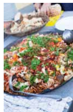
Nordisk paella i Beboerhuset