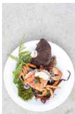
Vindermenu med krabbe