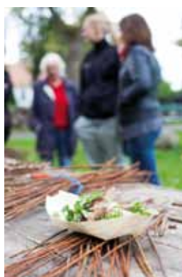
Pølser og pileflet