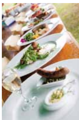
Retterne i pølsekonkurrencen

Læs mere om strandsafari her: www.strandsafari.dk