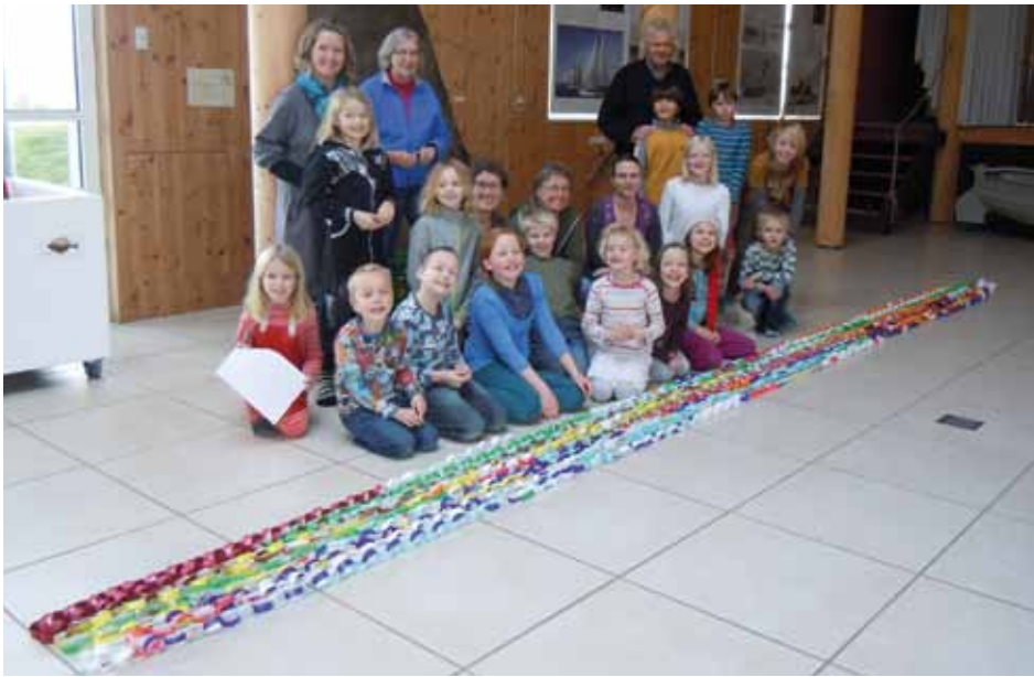
Stryno skoles bidrag i konkurrencen om den længste guirlande