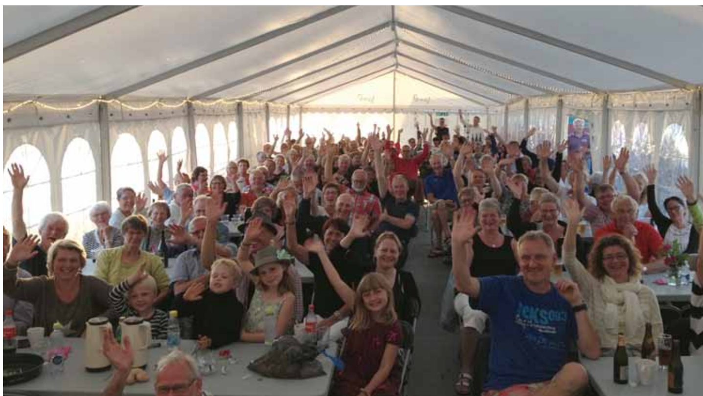
Alle ved hvordan Lasse & Mathilde ser ud. Her er et billede publikum og den gode stemning på Venø