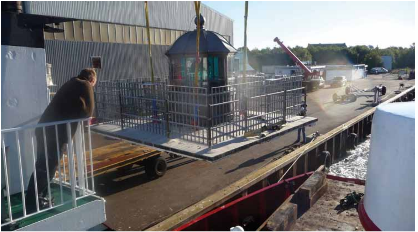
Fyrhatten hejses ombord på Assens-Baagø-færgen