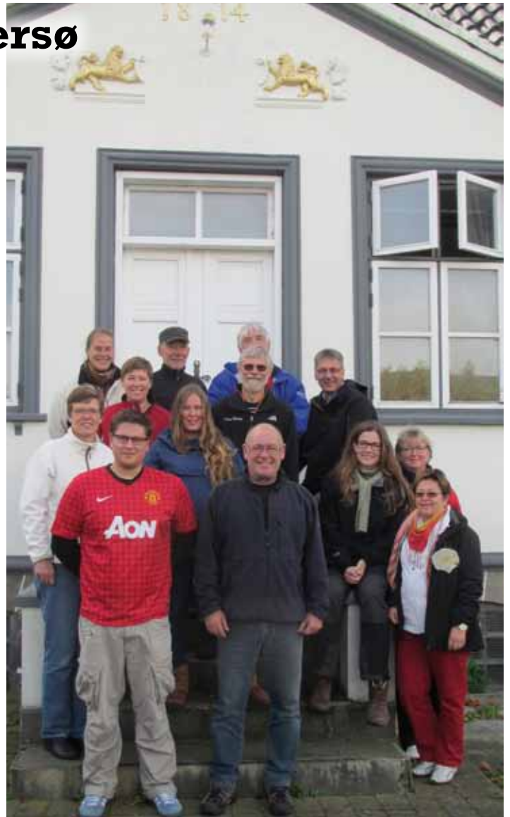
Ø-skolelærere foran Agersø Kro