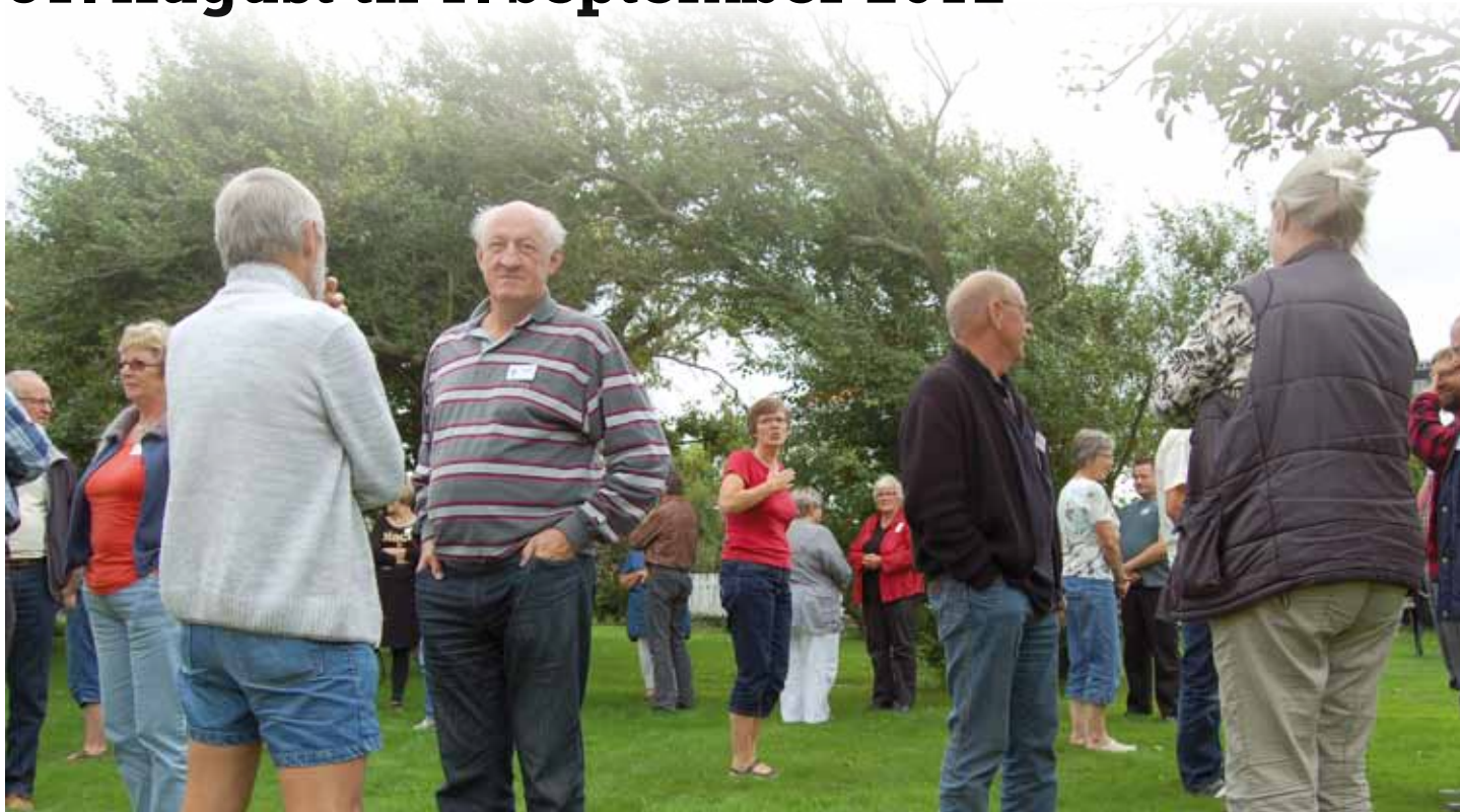
Bestyrelsesarbejde og erfaringsudveksling under åben himmel

Turen startede på Låningsvejen, som var en oplevelse i sig selv: vi er nogle der påskønner, at vi har færger i stedet for. Vi mødtes på Mandø Centret fredag aften ved 19-tiden og blev indkvarteret i dejlige værelser på Mandø Centret og Mandø BB. Begge steder kan leve op til de bedste hoteller, så prøv en ferie her.