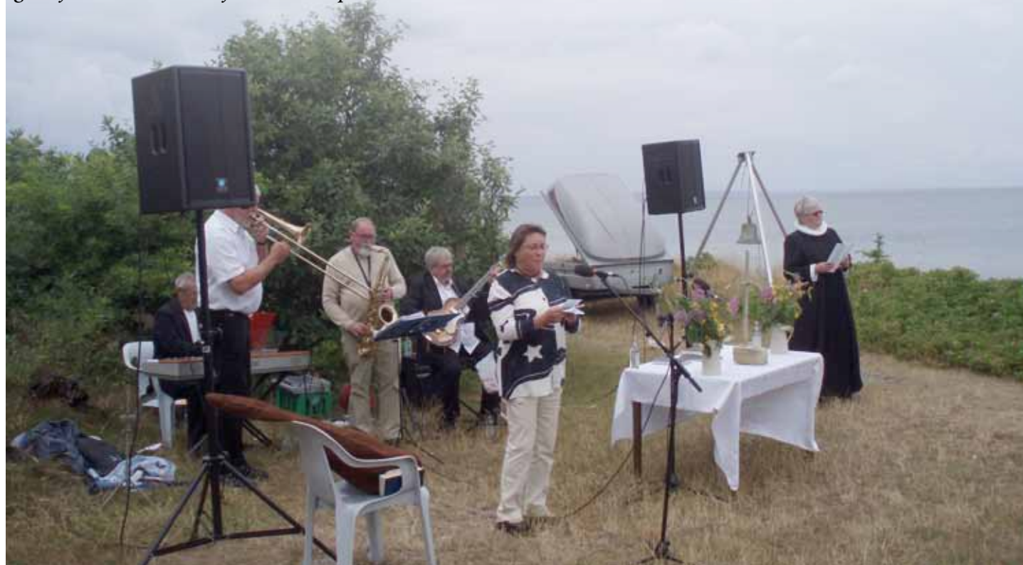
Gudstjeneste i det fri på Tunø

Læs om småøerne på de næste sider i Ø-posten. Og se mange flere arrangementer på øernes egne hjemmesider. Find hjemmesiderne på www.danskesmaaer.dk