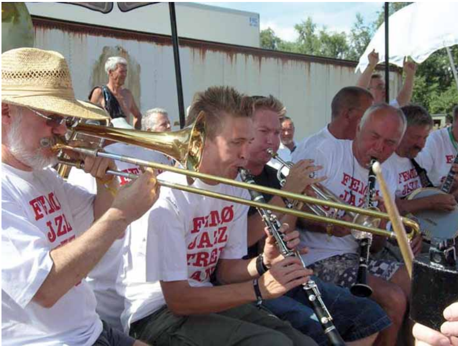
Femø Jazz Festival