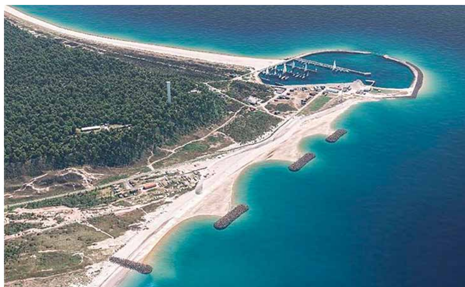
Projektet efter ca. 5 år, når sandet har lagt sig i lagunerne