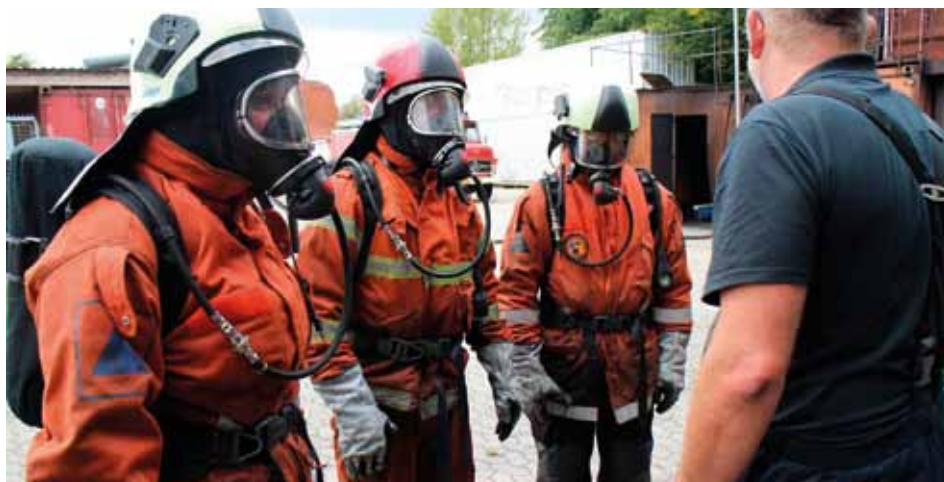
Brandfolk fra Strynø og Skarø på fælles øvelse

Mange af småøerne har frivillige brandkorps, der bliver kaldt til udrykning, når alarmen lyder. For øerne er de frivillige brandkorps vigtige: de kan være hurtigt på stedet, og begynde slukningen, mens man venter på, at brandvæsenet fra fastlandet kommer med færgen – eller som på Mandø at højvandet tillader det.