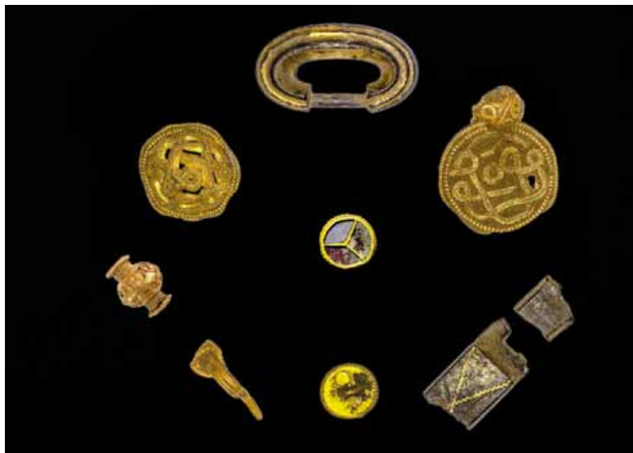
Meget tyder på, at dette guldfund er en ofring. Det består af kvindesmykker, guldperler, og brakteater med øsken, dvs. små, runde, guldblader, der kan bæres i en snor eller kæde om halsen

Læs mere på www.videnskab.dk eller www.vejlemuseerne.dk