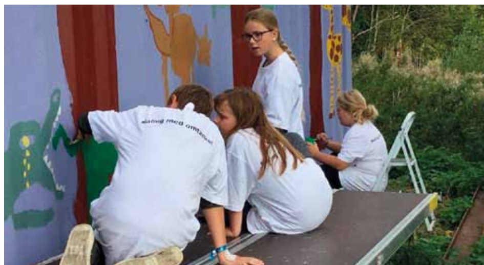
Der blev udvist stor koncentration og samarbejdsvilje under udførelsen af udsmykningen

Eleverne brugte tre torsdag formiddage, hvor de cyklende ud til golfklubben og arbejdede koncentreret med at male motivet. Det var imponerende at se dem