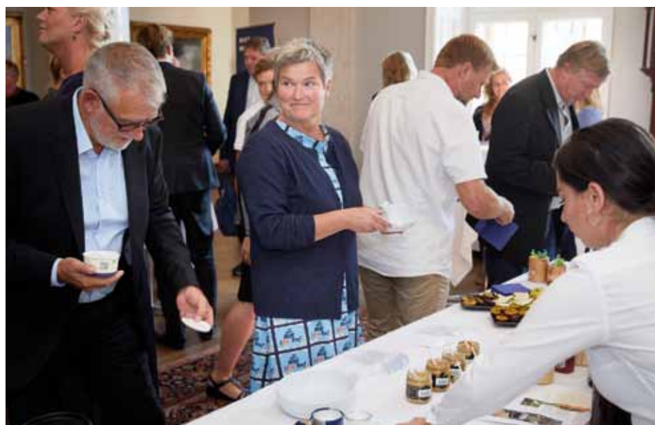
Der blev i bogstaveligste forstand smagt på øerne, med skønne ø-specialiteter