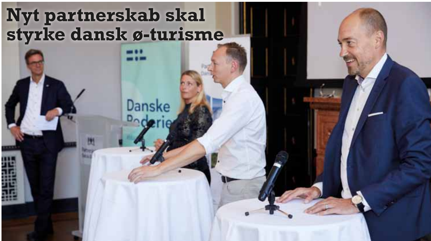
Mette Hjerminde Dencker (DF), Anders Johansson (KF) og Magnus Heunicke (S) fra Folketingets Udvalg for Småøer deltog i 'Smag på øerne'.

Der blev nydt ø-delikatesser i stride strømme i hovedstaden, da Danske Rederier en lun eftermiddag i september var vært ved lanceringen af et nyt samarbejde, der skal øge turismen og skabe vækst på øerne.