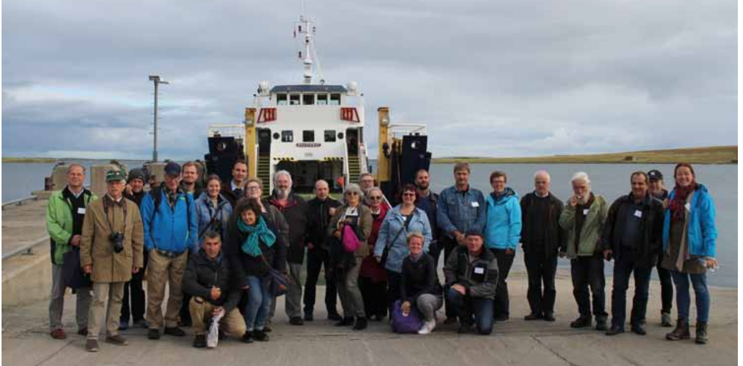
Delegerede fra Skotland, Grækenland, Danmark, Sverige, Irland, Frankrig, Estland, Åland og Finland deltog i ESINS årsmøde på de stormomsuste øer i Atlanten

ESIN, den europæiske småø-forening som Ø-sammenslutningen er medlem af, afholdt i år sin generalforsamling på Orkney i det nordlige Skotland.