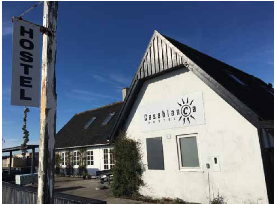
I maj åbnede Casablanca Hostel på Anholt Havn. Det skete med et tilskud fra LAG Småøerne til „Etablering af vandrehjem“

Selvom vi er „rummelige“ er der dog ting, vi lægger meget vægt på: