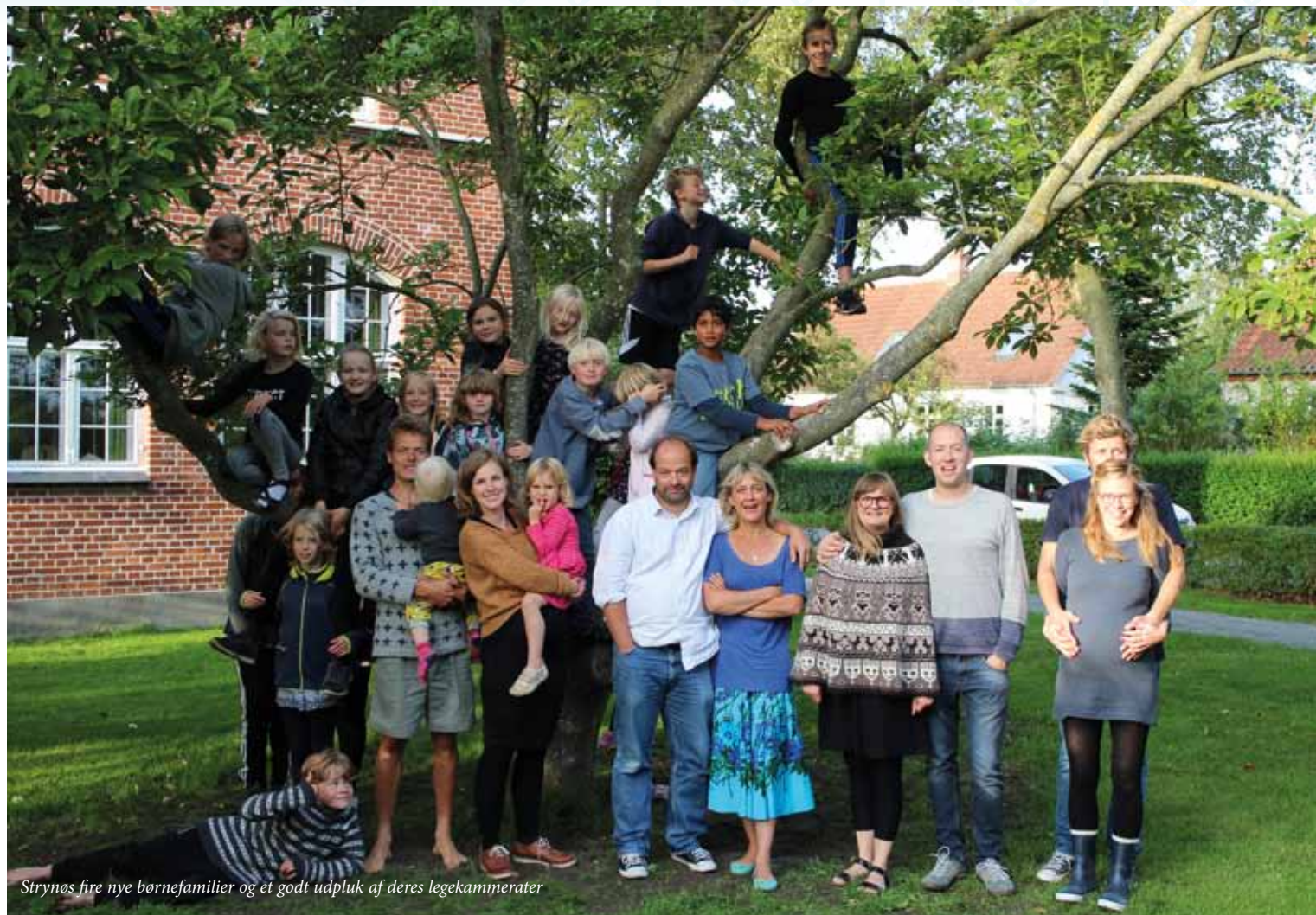
Strynø fire nye børnefamilier og et godt udpluk af deres legekammerater