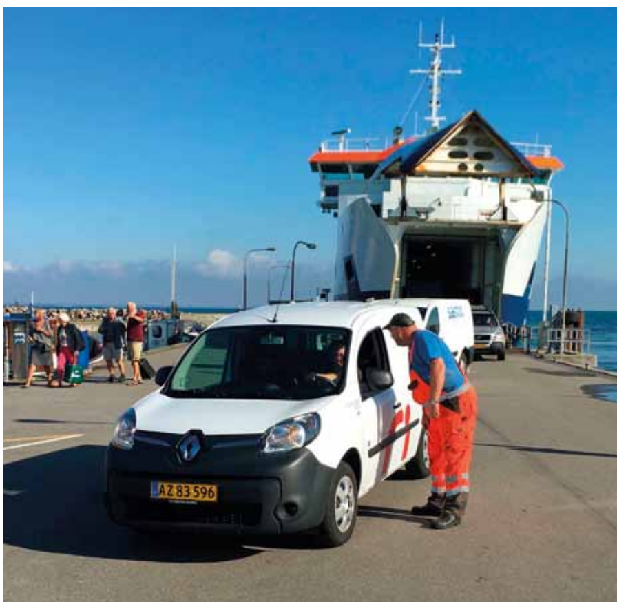
Den nye elbil på havnen på Endelave

Fra Facebook siden Kaninen Katrine fra Endelave