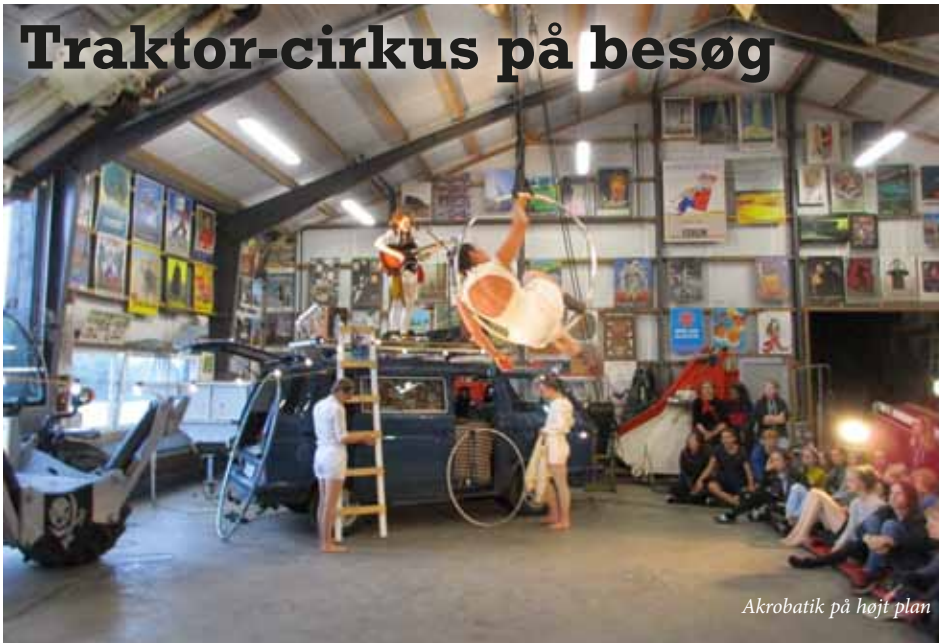
Akrobatik på højt plan

I september har Venø haft besøg af Kompani TO, der er en norsk artist og kunstnergruppe. Gruppen har holdt til på Venø Efterskole, hvor den har gennemført workshops med skolens elever. For Venøboerne blev det til en række meget forskellige optrædener på Venøfærgen, museumsfærgen Venøsund på kajen og på Venø Havn.