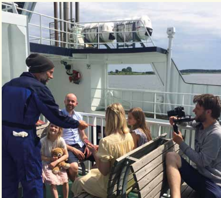
Filmholdet under optagelserne på Oro-færgen