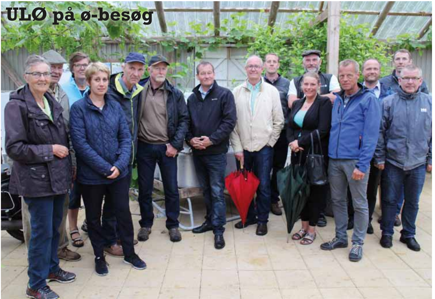
Politikere og ø-folk i Barsøs fine orangeri med udstilling om øen

Udvalget for Landdistrikter og Øer (ULØ) har tradition for en gang om året at tage på tur til en eller flere af de danske småøer. I år gik turen til to af de mindre øer – sådan rent befolkningsmæssigt – nemlig Baagø og Barsø i Lillebælt.