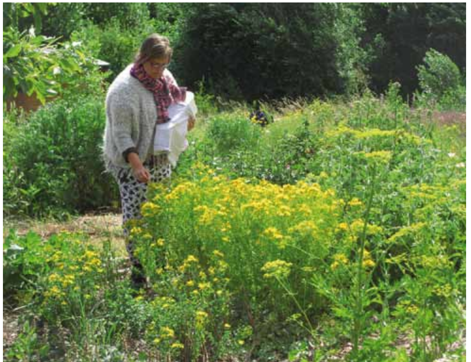
Den Helbredende Have på Fejø

Du kan læse mere om den meditative haveuge på Den Helbredende Haves hjemmeside helbredendehave.dk . Du er