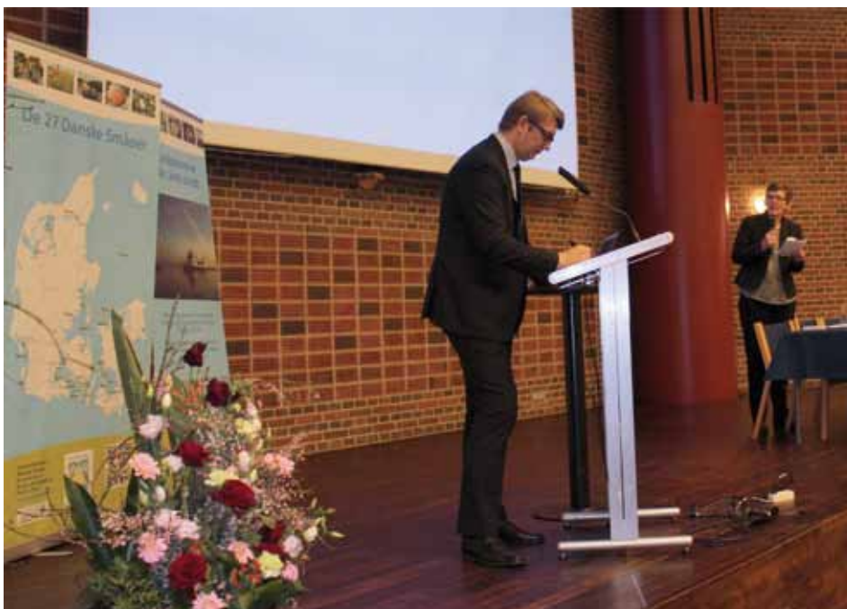
Erhvervs- og vækstminister Troels Lund Poulsen