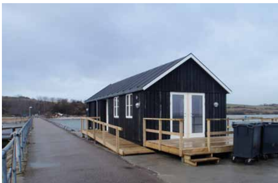
Nekseløs nye havnehus

Så fik Nekselø endelig sit hus på havnen. Det tog også 3-4 år fra vi begyndte at foreslå kommunen det, til det nu står færdigbygget. Huset skal fungere som ly for vores mange turister, når de bliver overrasket af en ordentlig regnbyge. Før i tiden blev turisterne bare våde – der var ingen steder, de kunne gå i læ. Der er et stort rum i huset samt