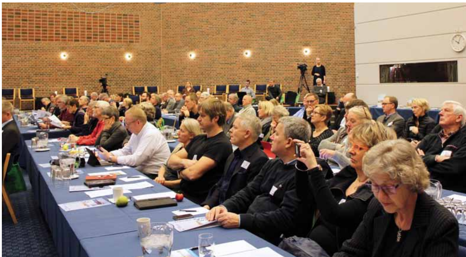
Småøernes Kommunekonference samlede over 100 deltagere i Odense

Sammenslutningen af Danske Småøer inviterede den 1. februar til debat om udviklingen på småøerne. Konferencen samlede over 100 deltagere så som folketings- og kommunalpolitikere, forvaltningschefer og embedsmænd, ø-repræsentanter og andre nøgleinteressenter i småøernes forhold.