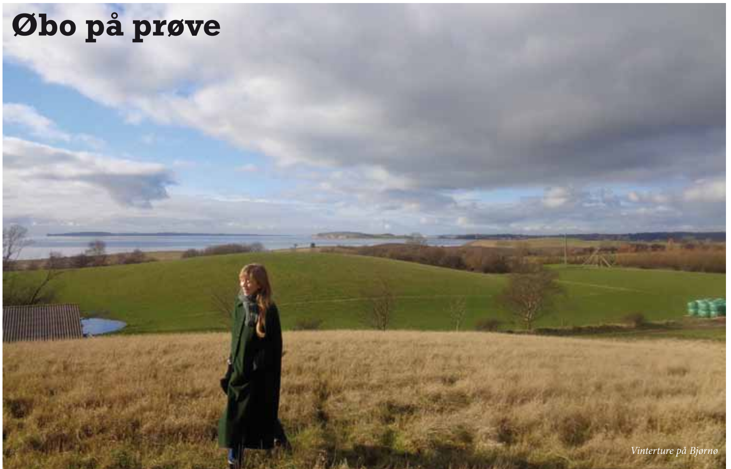
Vinterture på Bjørnø

Egentlig har jeg altid tænkt på mig selv som øbo. Jeg er jo fra Fyn! Men der er øer, og så er der øer. Hvis jeg ikke vidste det før, så står det klart efter jeg flyttede fra Odense og lejede et lille stråtækt hus på Bjørnø i december 2015. Lige da vinteren begyndte og dagene var aller-kortest. Har man færge hjem, så er man øbo. Måske endda først når man kommer for sent til sidste færge til fastlandet, og går tilbage til huset, og tænder lyset igen og affinder sig med, at det åbenbart ikke skulle være i dag.