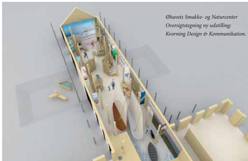
Øhavets Smakke- og Naturcenter Oversigtstegning ny udstilling: Kvorning Design & Kommunikation.