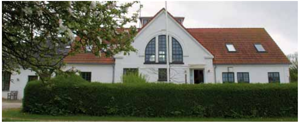
Strynø gl. Mejeri

De tekniske krav er adgang til en stabil internet forbindelse med min. 3 Mbit/s samt en projektor og et godt lydanlæg (det er ikke nok med lyd fra indbyggede pc højtalere).