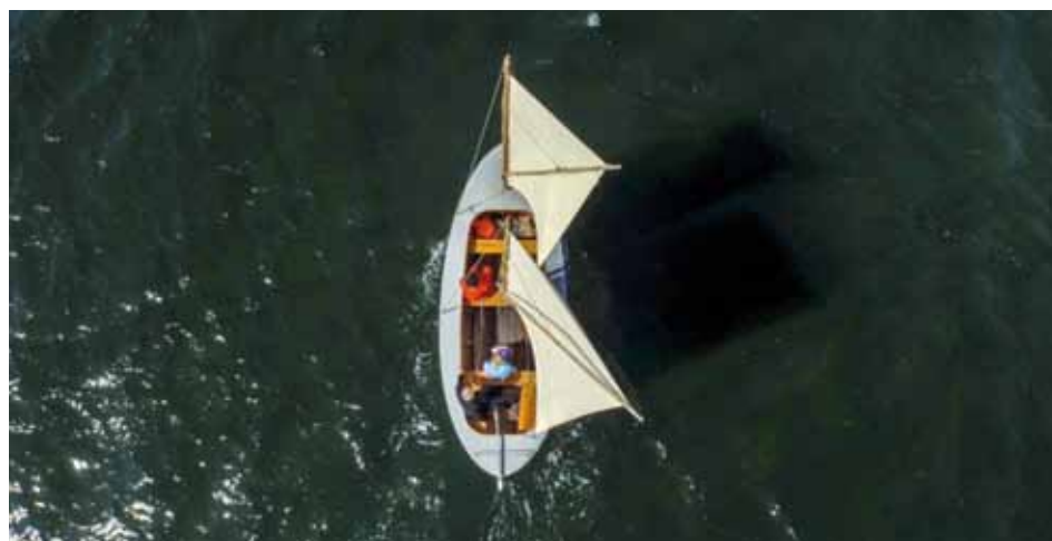
Smakkejolle under sejl