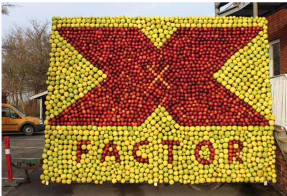
Fejøs helt egen udgave af X-factor logoet i æblemosaik

Thomas Blachman havde aldrig været på Fejø tidligere, men havde været meget på Møn og kunne se mange lighedspunkter: „Jeg elsker de der små øer, der får stjernerne til at funkke og har deres eget tempo“. Også Mette Lindberg blev imponeret af Fejø og udtalte: „Det var sindsygt smukt. Folk var helt vildt søde, og