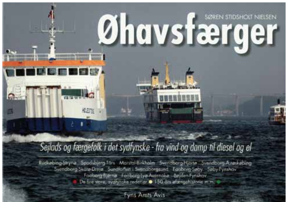
'Øhavsfærger' er udgivet af Fyns Amts Avis og koster 350 kr.