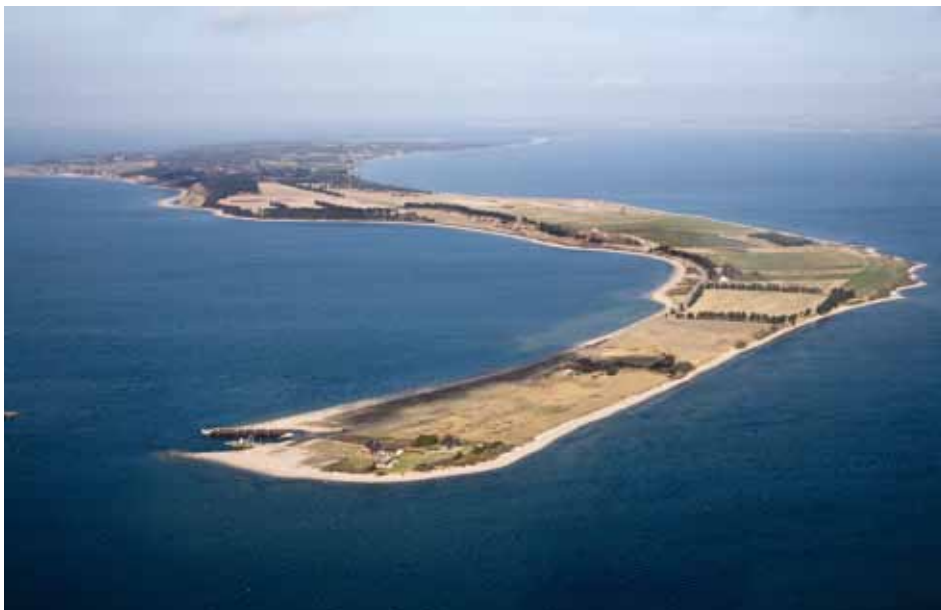
Venø set fra luften