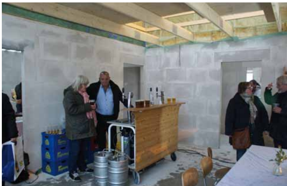
Rejsegilde i Årø Vingårds nye bygning

Den 29. januar blev der i en strid vind afholdt rejsegilde på Årø Vingårds nye besøgsbygning. Mange mødte op for at fejre vores nye bygning. Det var dejligt at møde opbakningen både fra øens beboere, men også fra alle gæsterne, der kom til rejsegildet fra fastlandet.