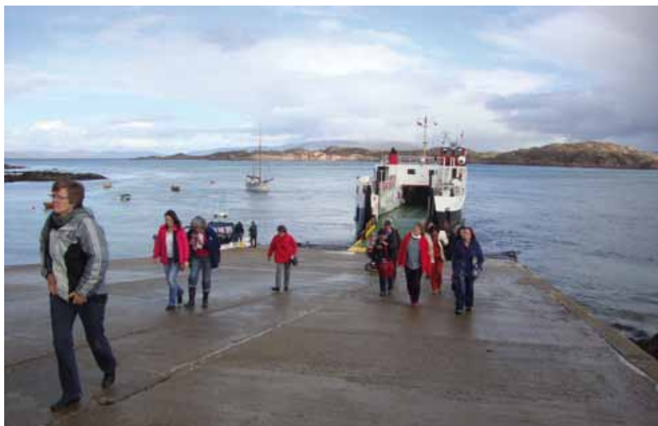
Deltagerne i ESIN årsmødet går i land på Iona med Isle og Mull i baggrunden

Årets møde i ESIN fandt sted i midten af september på den bjergtagende smukke ø Isle of Mull i det vestlige Skotland. ESIN er en netværksorganisation bestående af europæiske småø-organisationer fra ti nationer. Foruden den skotske værtsnation deltog Sverige, Finland, Åland, Frankrig, Irland og Danmark i årsmødet.