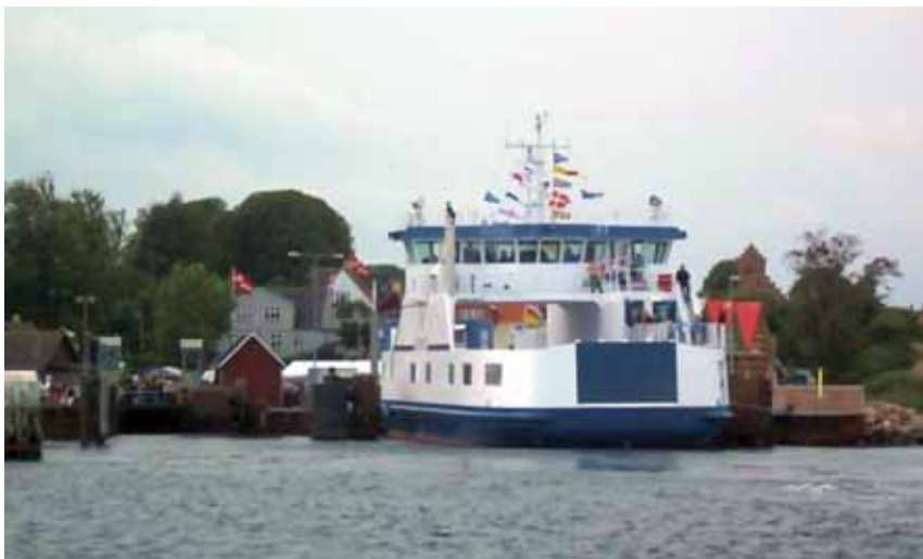
Den nye færge navngives „M/F AGERSØ III“