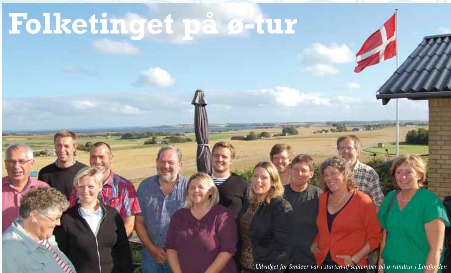
Udvalget for Småøer var i starten af september på ø-rundtur i Limfjorden

„Blæsten går frisk over Limfjordens vande...“ – og det gjorde den da også da Udvalget for Småøer i starten af september besøgte Venø, Fur og Egholm.