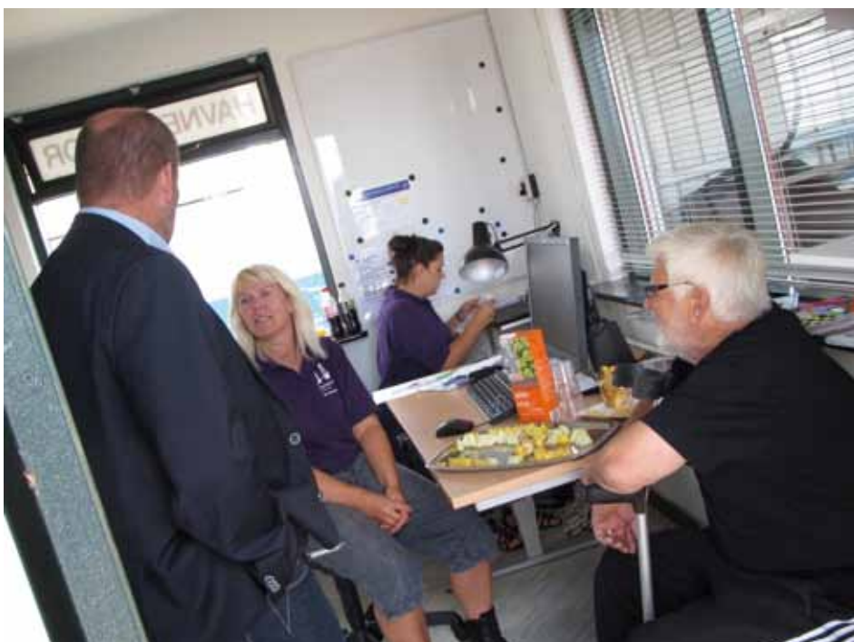
Fra åbningen af borgerPC i det gamle havnekontor på Omø