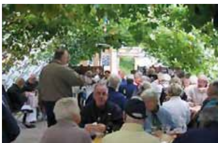
Kulinarisk oplevelsesturisme på Årø

Alle producenter har haft besøg 2 gange i forløbet, hvor man sammen har udviklet virksomhedens kernehistorie.