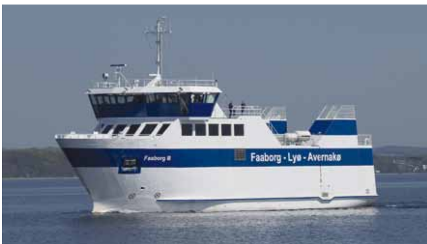
FAABORG III på ruten mellem Faaborg-Lyø-Avernakø