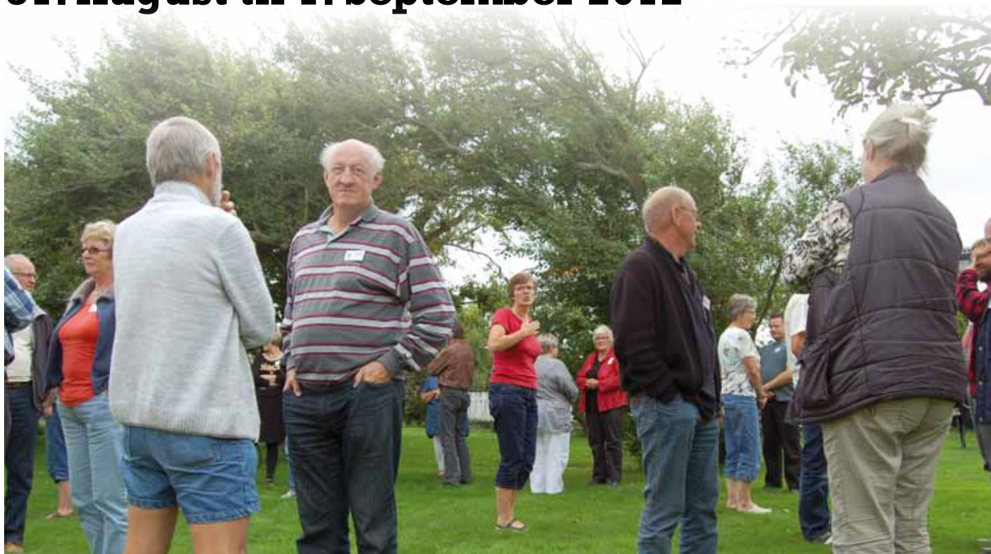
Bestyrelsesarbejde og erfaringsudveksling under åben himmel

Turen startede på Låningsvejen, som var en oplevelse i sig selv: vi er nogle der påskønner, at vi har færger i stedet for. Vi mødtes på Mandø Centret fredag aften ved 19-tiden og blev indkvarteret i dejlige værelser på Mandø Centret og Mandø BB. Begge steder kan leve op til de bedste hoteller, så prøv en ferie her.