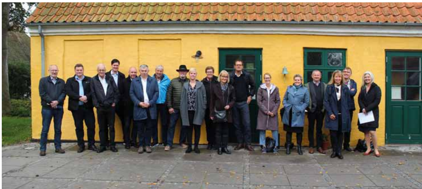
Folketingets statsrevisorer, Lyøboere og repræsentanter fra Ø-sammenslutningen, LAG Småøerne, Erhvervsstrelsen og Faaborg-Midtfyn Kommune foran Lyø Kulturhus

Folketingets statsrevisorer besøgte i september på deres indenrigsbesigtigelse, som i 2017 omhandlede udkantsområder med særlig fokus på småøers vilkår, tre af vores småøer. Statsrevisorerne var sidst på øbesøg i august 1999.