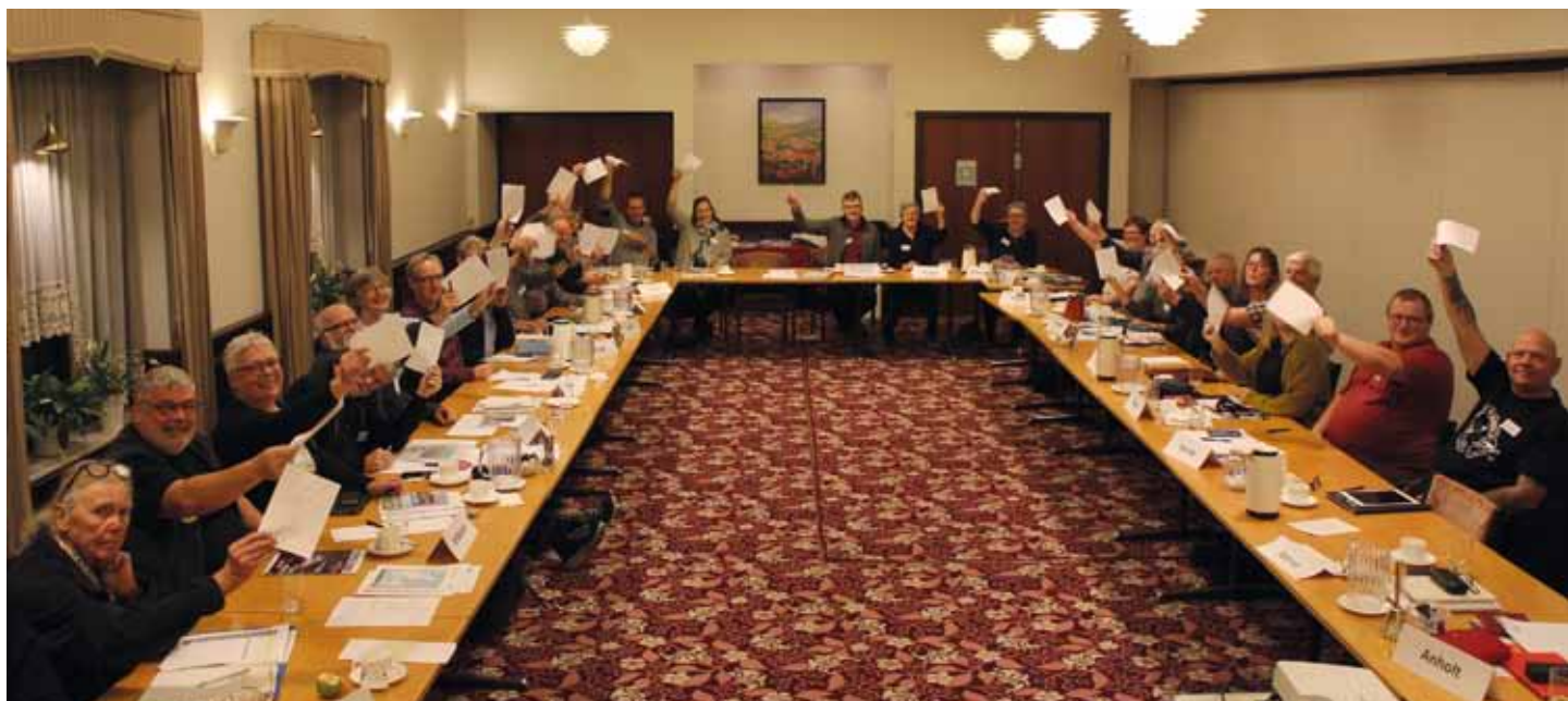
Ø-repræsentanter vifter med de gode ø-historier

Repræsentanter fra 21 småøer mødte frem til efterårets ø-træf. Årets tema på repræsentantskabsmødet var 'den gode historie – og hvordan den kommunikeres'.