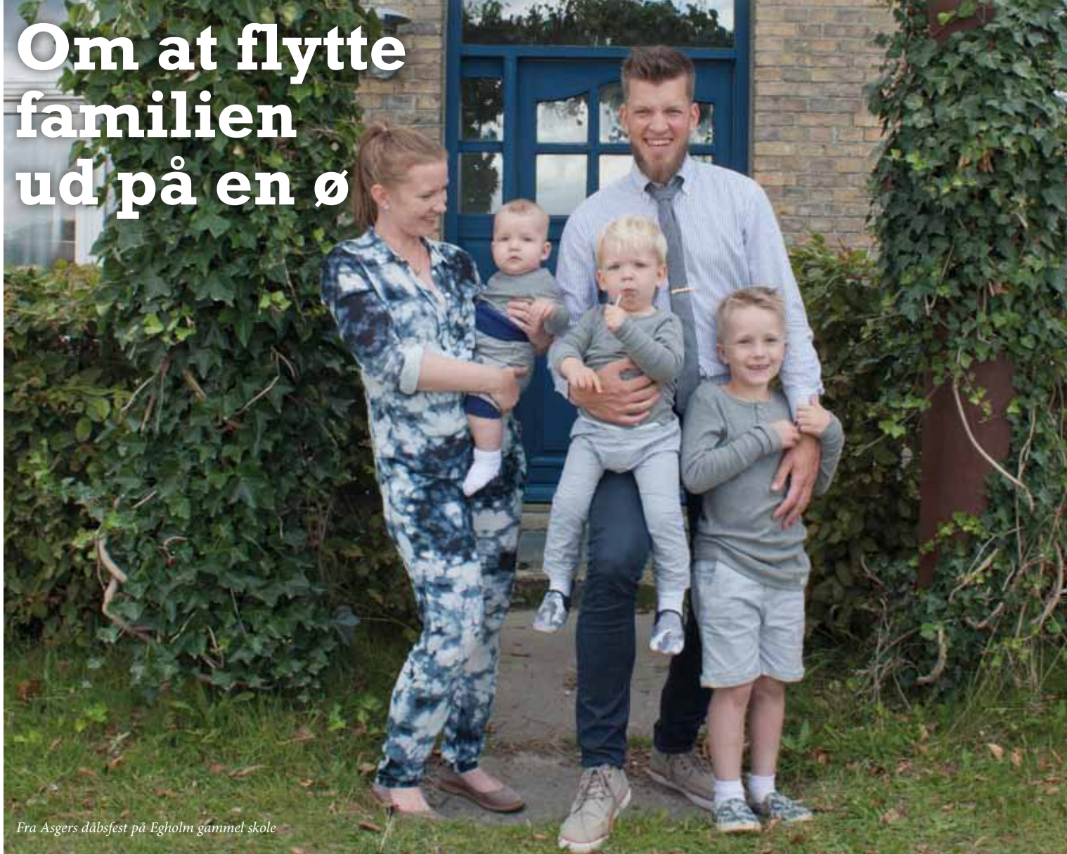
Fra Asgers dåbsfest på Egholm gammel skole

Vi havde længe haft et godt øje til Egholm og havde besøgt øen flere gange, da vi valgte at holde vores yngste søns dåbsfest på øens gamle skole. Den gamle skole havde masser af plads samt historie, og vi ville gerne vise vores familie en af de mest unikke steder i Aalborg.