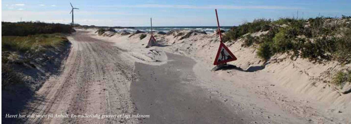
Havet har ædt vejen på Anholt. En midlertidig grusvej er lagt indenom

Der er ikke mange mennesker med færgen Anholt en mandag i begyndelsen af oktober. Nogle få håndværkere, enkelte Anholtere, som har været ovre på fastlandet i weekenden og så fire gæster, som skal fortælle om det arbejde, Sammenslutningen af Danske Småøer (SaDS) og LAG småøerne udfører.