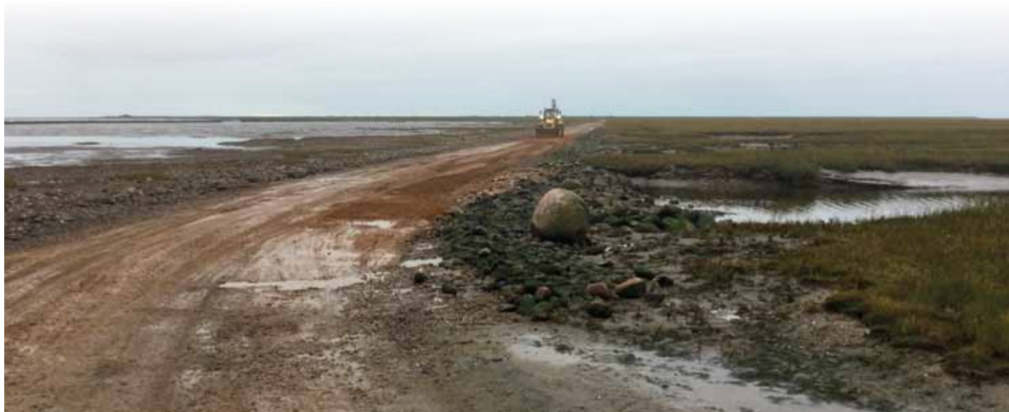
Stormen Ingolf var hård ved Mandøs låningsvej. Ødelæggelserne tog flere dage at reparere, mens mandøboerne var afskåret fra fastlandet

Øens 4 vandværker lagt sammen til et nyt vandværk, indviet i