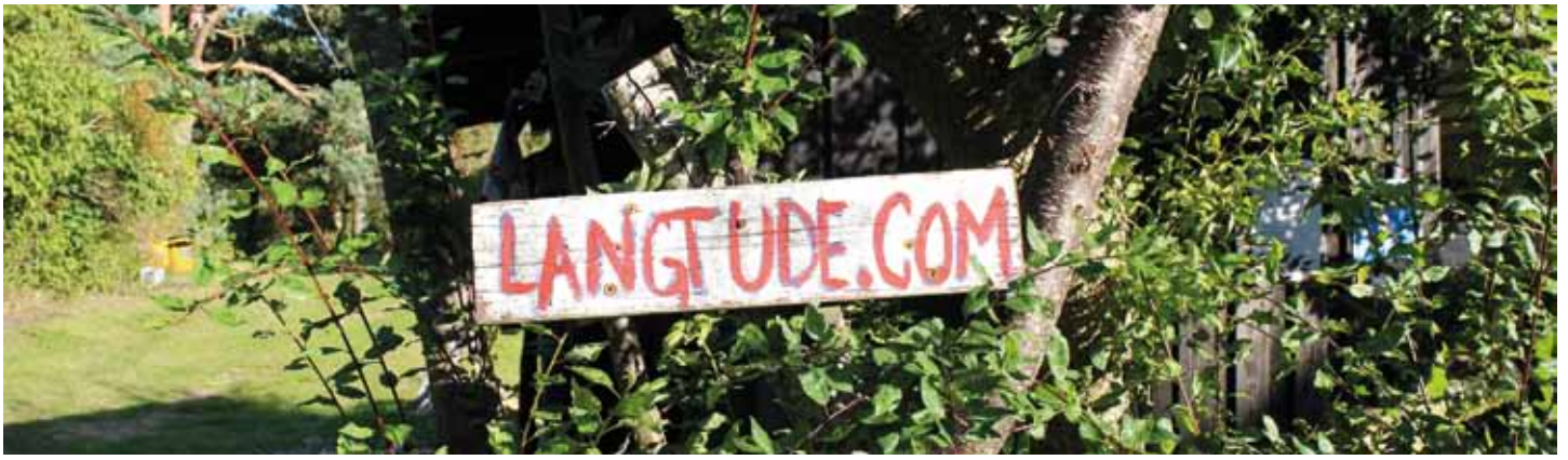
Festivalen på Anholt er 'langt ude'...