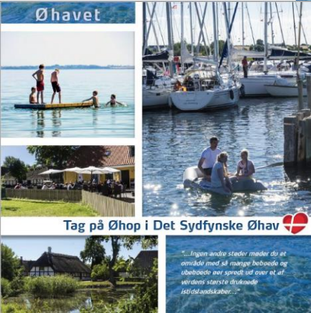
Guide til Øhavet