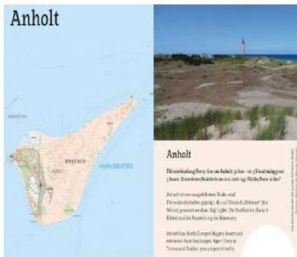
Hier können Sie den Pass ansehen und bestellen