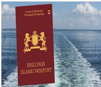
Was ist der Insepass?