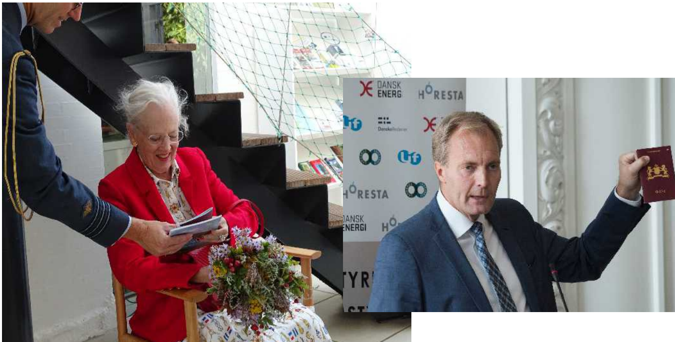
Ø-pas på ny ministers bord

Færgeseekretariatets høring i Landstingssalen Horestas konference på Christiansborg Kommunernes Landsforenings Turismetræf InnoCoast - Midtvejskonference