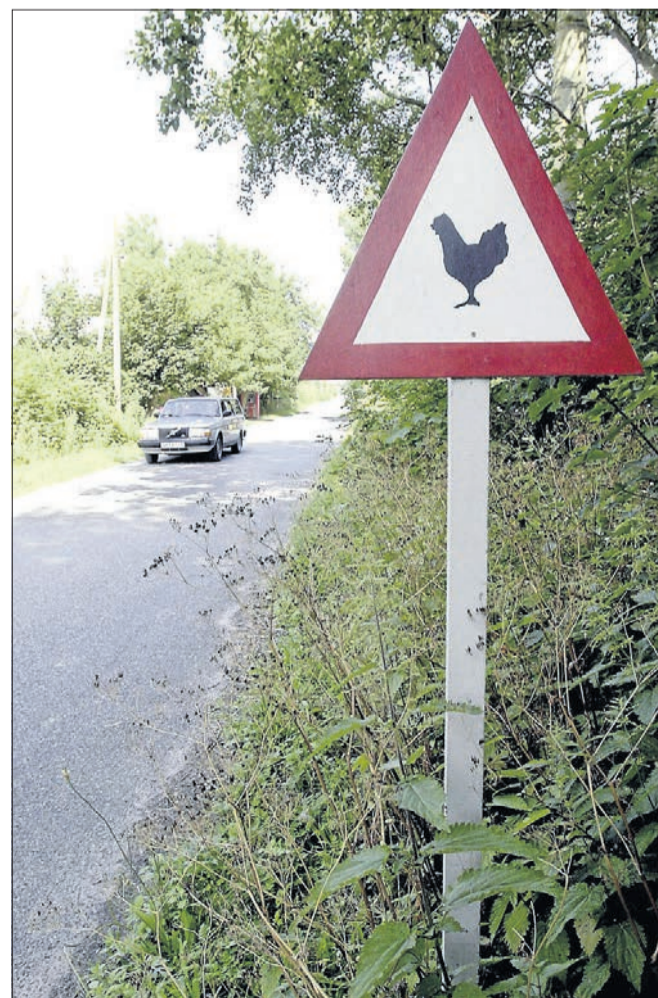
Sejerø byder på mange overraskelser... Også på vejene. Arkivfoto

leve både på hesteryg og på jernhesten, så ønske cykelruter skal også markedsføres i større grad.