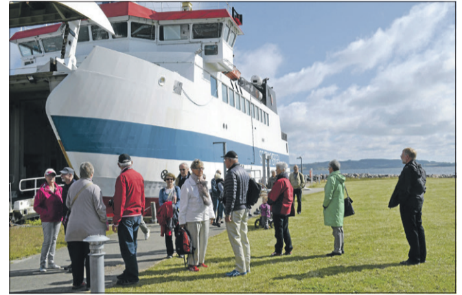
Læsere af avisen er klar til hestevognturen på Sejerø.