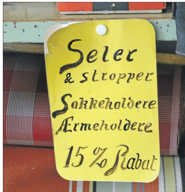
Detalje fra købmandsmuseet i Sejerby.

Vuggende gennem Sejerø- og Neksøbugtens små bølger bringer Sejerøfærgeren os retur til Havnsø.