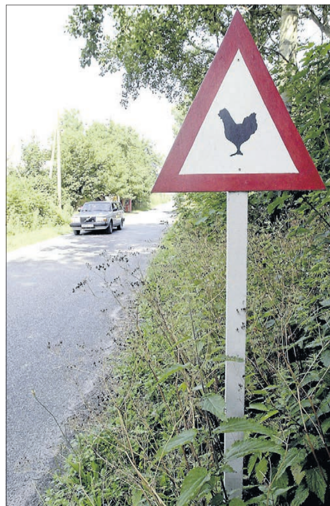
Sejerø byder på mange overraskelser... Også på vejene. Arkivfoto

leve både på hesteryg og på jernhesten, så ønske cykelruter skal også markedsføres i større grad.