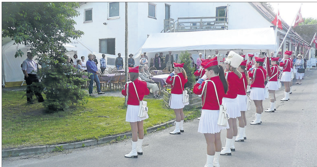
Ruds Vedby Garden åbnede weekendens gademusikfestival med at marchere fra skolen til festpladsen, hvor de spillede et par numre.