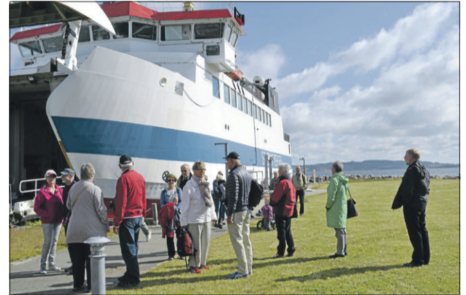
Læsere af avisen er klar til hestevognturen på Sejerø.