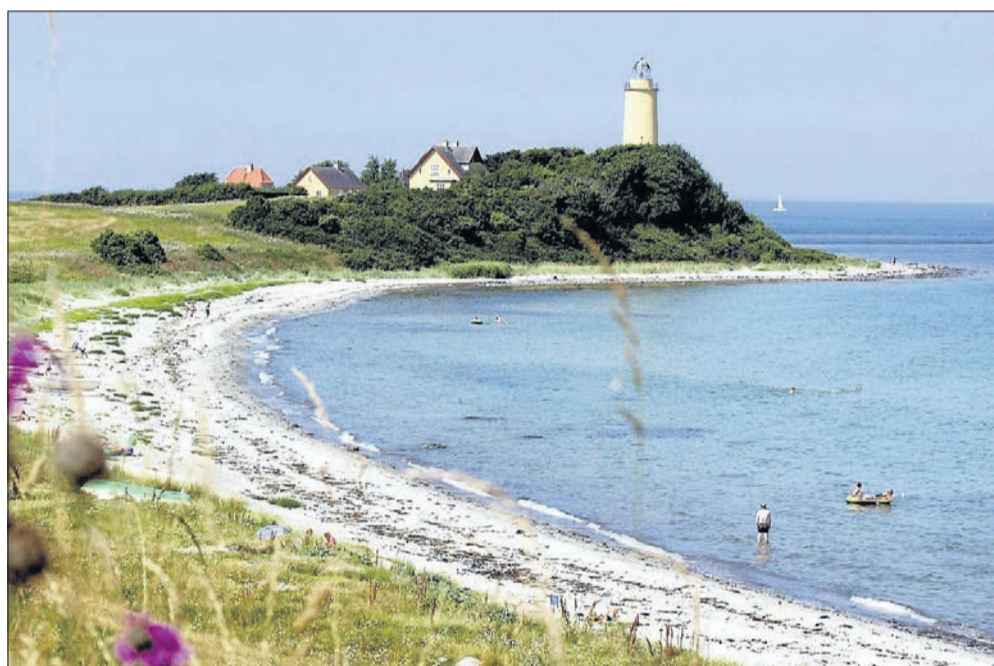
Besøg Sejerø fyr, der er flot udsigt på klare dage.