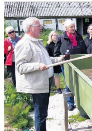
Hos Endelave Seaweed gav B introduktion til de mange muligheder for kommercielt.