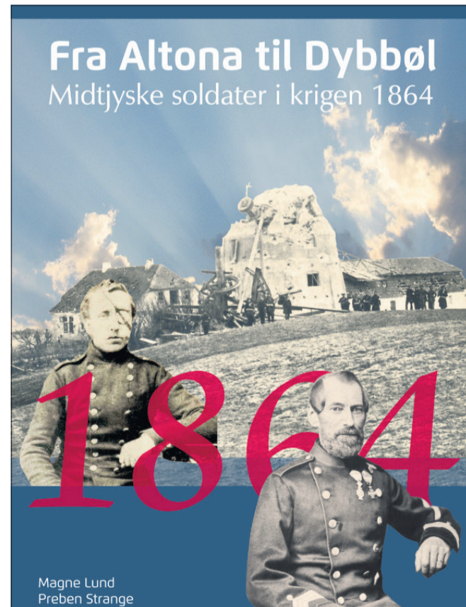
"Fra Altona til Dybbøl" er kommet på gaden med masser af historier om lokale personers deltagelse i slaget ved Dybbøl.

skildringer fra sognene omkring Brædstrup, bl.a. Grædstrup, Tønning, Bryrup, Østbirk, Tyrsting, Nørre Snede, Vrads, Them, Klovsborg og Sdr. Vissing samt andre steder i det gamle Skanderborg Amt. Mange familier vil kunne finde slægtsmedlemmer omtalt.