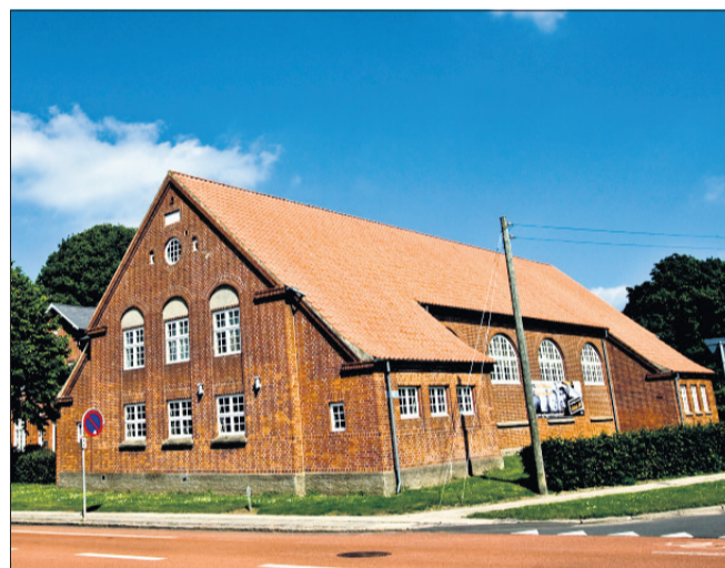
Gedved Bibliotek flytter på torsdag ind i Gedved Kultur- og Medborgerhus.