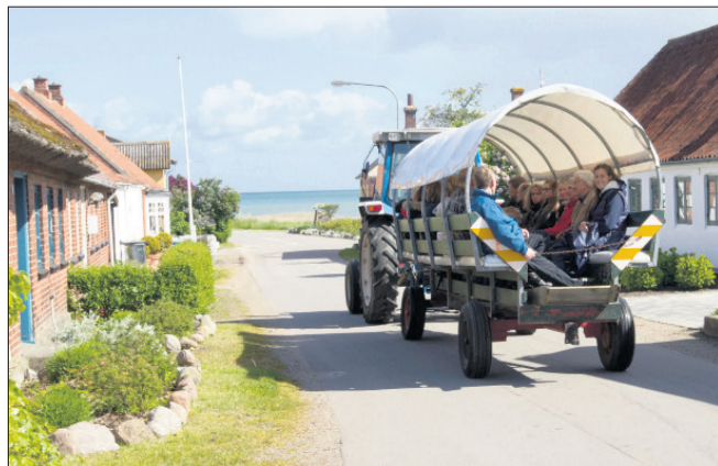
Turen rundt på øen foregik på traditionel Endelave-vis.

Med på turen var også otte af kommunens turistambas-