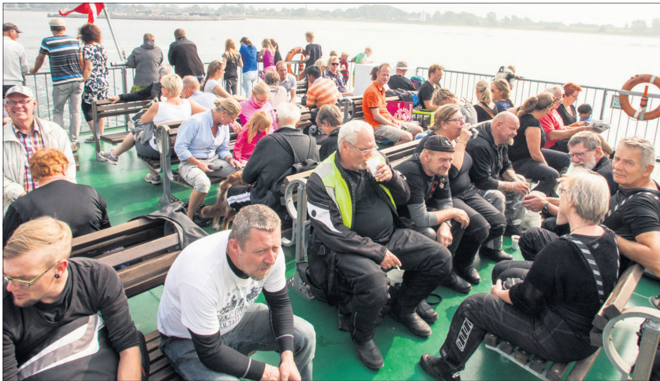
Der var fyldt godt op på endelavefærgens soldæk, da færgen søndag eftermiddag sejlede tilbage til fastlandet.