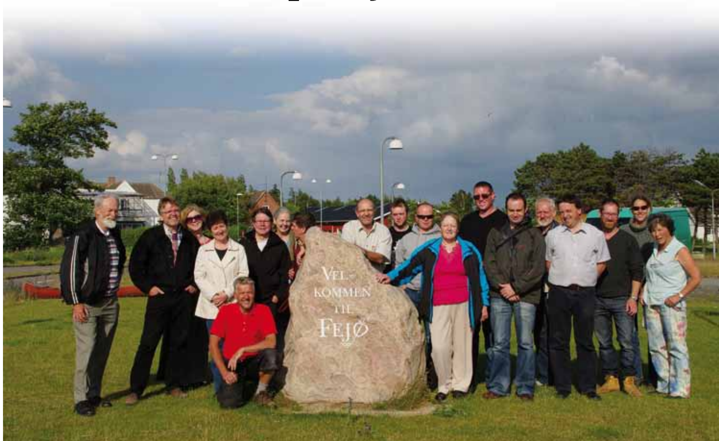
Tunboere, fejbattinger, og anholtboere i godt selskab med irske øboere

Der var god energi på Fejø weekenden den 18.-19. juni. Hold da op, hvor var det godt.