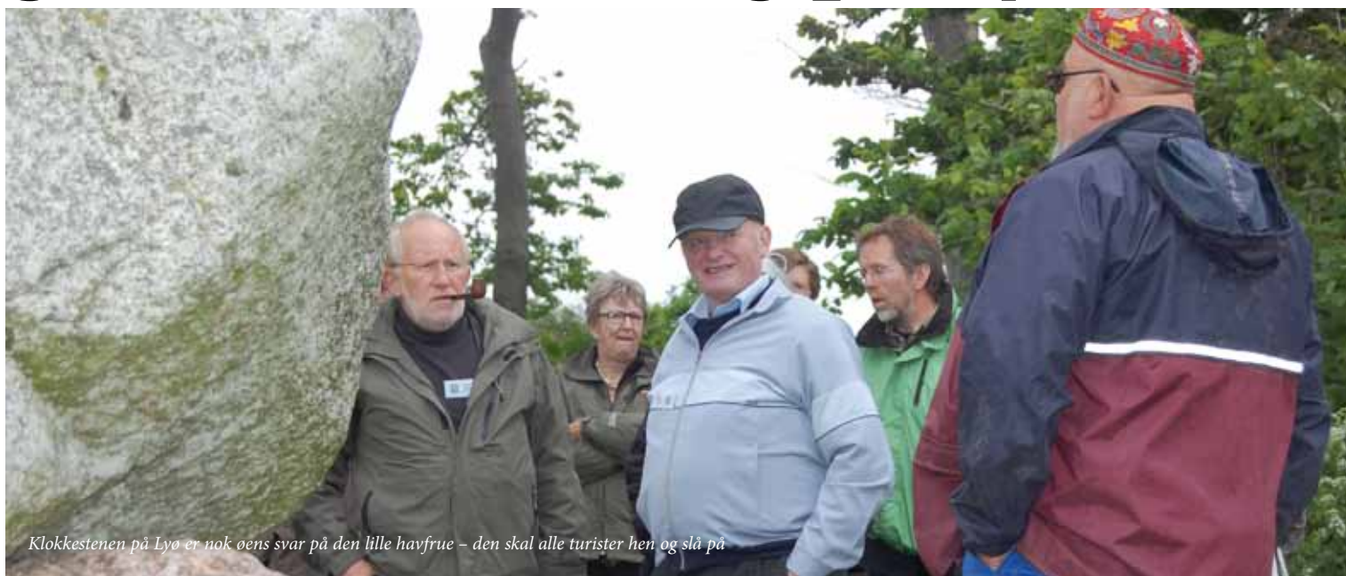
Klokkestenen på Lyø er nok øens svar på den lille havfrue – den skal alle turister hen og slå på