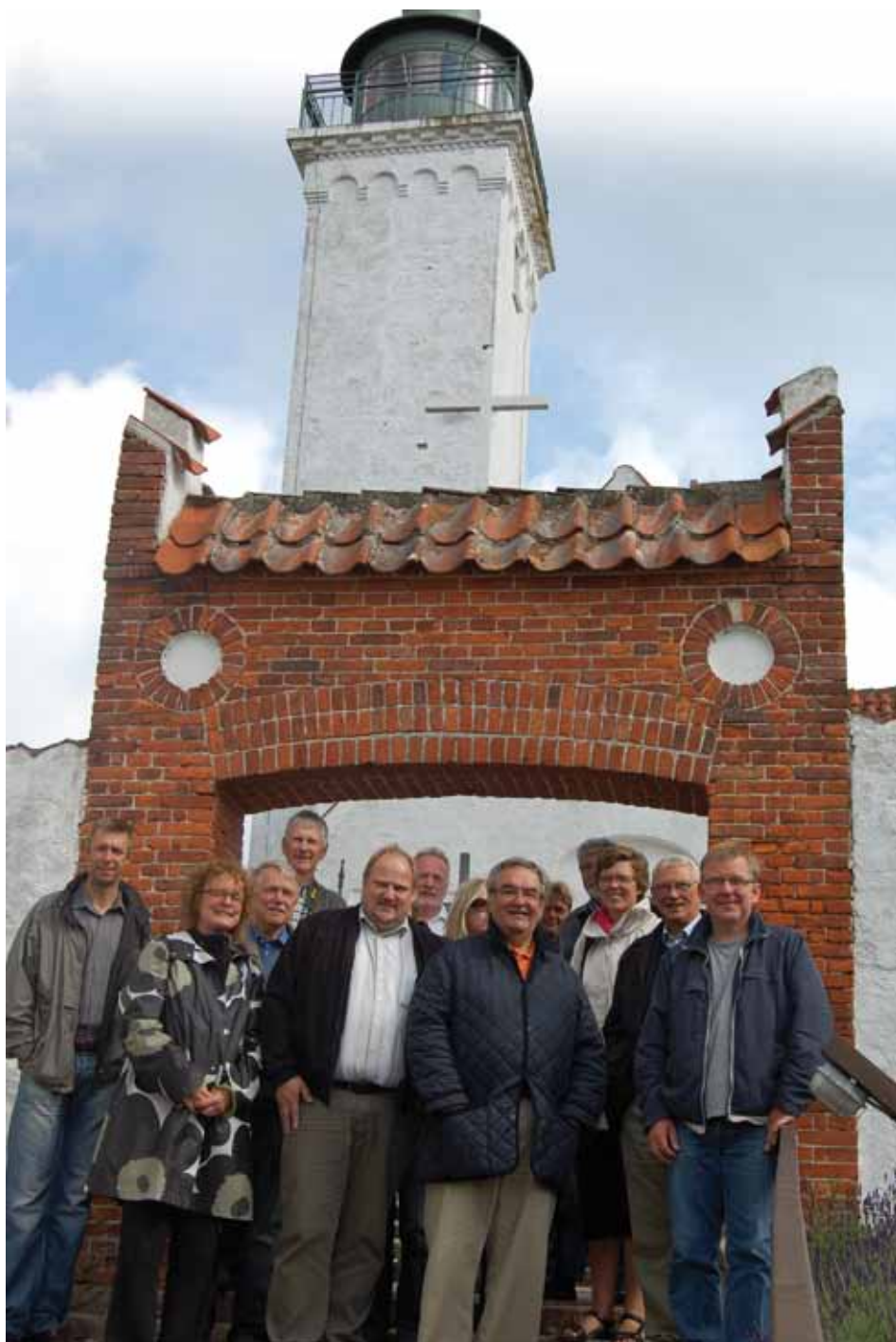
Øboere og politikere i samlet flok foran Tunø Kirke

På trods af nok den ringeste fartplan blandt Ø-sammenslutningens øer, så har Tunø haft en bemærkelsesværdig befolkningstilvækst de sidste 10-12 år. Fortrinsvis bestående af tilflyttende seniorer, men også enkelte børnefamilier. Men øen indbyder ikke til pendlende erhvervsaktive øboere med kun to afgangene om dagen, hhv. formiddag og eftermiddag, så tilflytningen er sket på trods af disse hårde odds. Færgeren var naturligt et væsentligt debattemne ved mødet mellem politikere og øboere, og især stod kommunens beslutning om at spare finansieringen af Tunøs sygeplejerske væk for skud. Tonen mellem øboere og de kommunale politikere var ligefrem og til tider barsk. Tunø Beboerforening har indklaget Odder Kommune for statsforvaltningen, da man mener, at Odder kommunes særregler for hjemmepleje på Tunø er ulovlig forskelsbehandling af borgerne i kommunen. Der er ikke kommet svar på Tunøs klage endnu. Tunø Beboerforening har også afviklet en „folkeafstemning“ på øen, hvor borgerne blev bedt om at svare på om man ønskede sig øen ind under Århus kommune i stedet for. Det var der et stort flertal for, men det er ikke så simpelt i