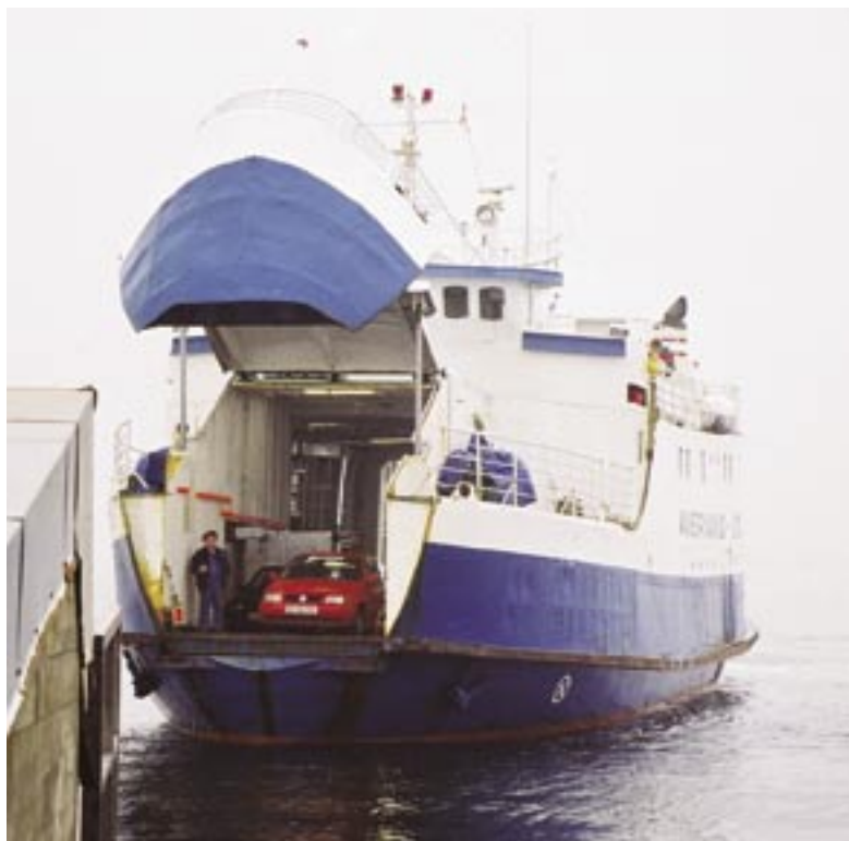
Færgen til Avernakø og Lyø står overfor en nødvendig udskiftning. Med 43 år på bagen er den godt slidt og kræver mange reparationer. Det har medført mange aflyste afgang for øboerne

Den ældste færge der sejler i dag, er færgen til Venø, som blev bygget i år 1956. Men også færgerne til eks. Strynø (byggeår 1966) og Avernakø/Lyø (byggeår 1966) er bedagede damer. Længst fremme med konkrete planer om færgeinvesteringer er man