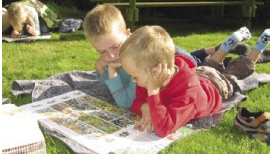
Når vejret er godt, så kan græsplænen også bruges som klasseværelse

Omø Skole er den gamle præstegård fra den tid, hvor præst og lærer var en og samme person, bygget i