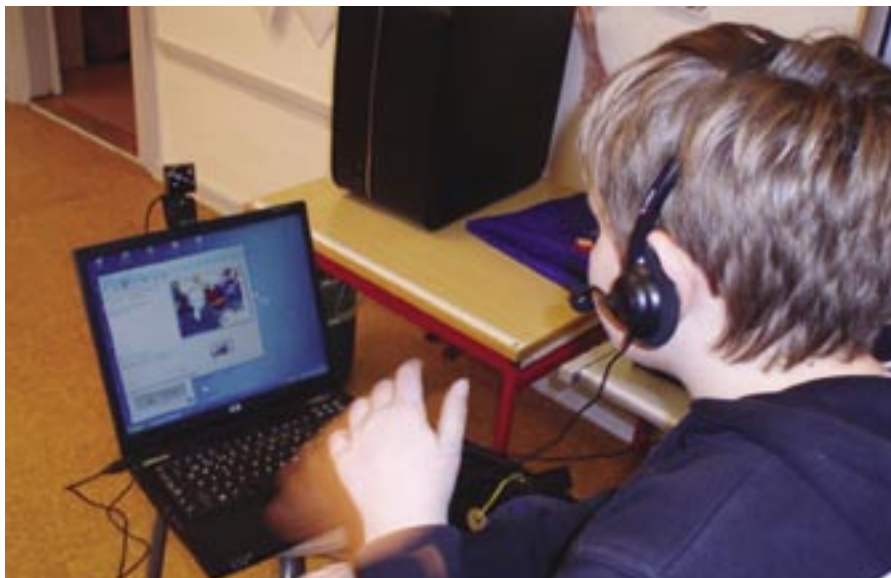
Også på Lyø Skole er ny teknologi blevet et vigtigt redskab i undervisningen

Som lærere på Lyø skole har vi stor glæde af samarbejdet med de andre ø-skoler, både på kurserne og i