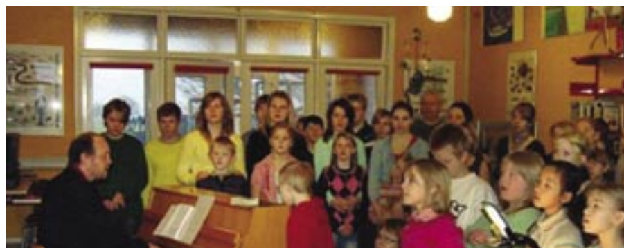
Elever på Fur skole samles om sang og musik

Fur Skole eksisterer ikke længere som en selvstændig skole efter sommerferien 2008, men bliver ét af to undervisningssteder i den nye skole Fur-Selde Skole. Det er bl.a. det faldende børnetal – også i vort område, der har fremtvunget sammenlægningen.