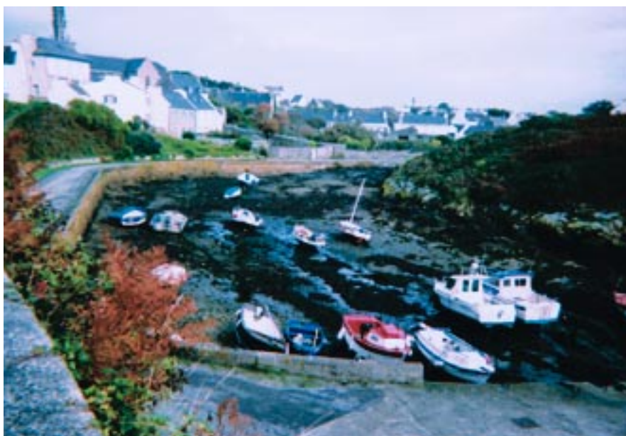
Dramatisk kan det se ud, når det er lavvande i havnen

tancelearning på universitetsniveau og dyre videokonferencer på højt niveau muligt. Kurserne varer 8 måneder over vinterhalvåret med 35 timer pr. uge. Ventelisterne er lange, man skal regne med 1-2 års ventetid. Det har vist sig, at deltagerne kommer fra alle sociale lag og alle aldersgrupper, fastboende og turister. Det er af stor betydning for de øer, hvor 85% af befolkning om sommeren er turister. På den store ø, Croix, tilbydes træningskurser for skolebørn i lektietimerne (timer efter undervisningstid). Der bruges Wymax, trådløst bredbånd, som er forholdsvis billigt, og visuel kontakt imellem