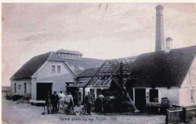
Femø mejeri 1910 www.kimball.dk