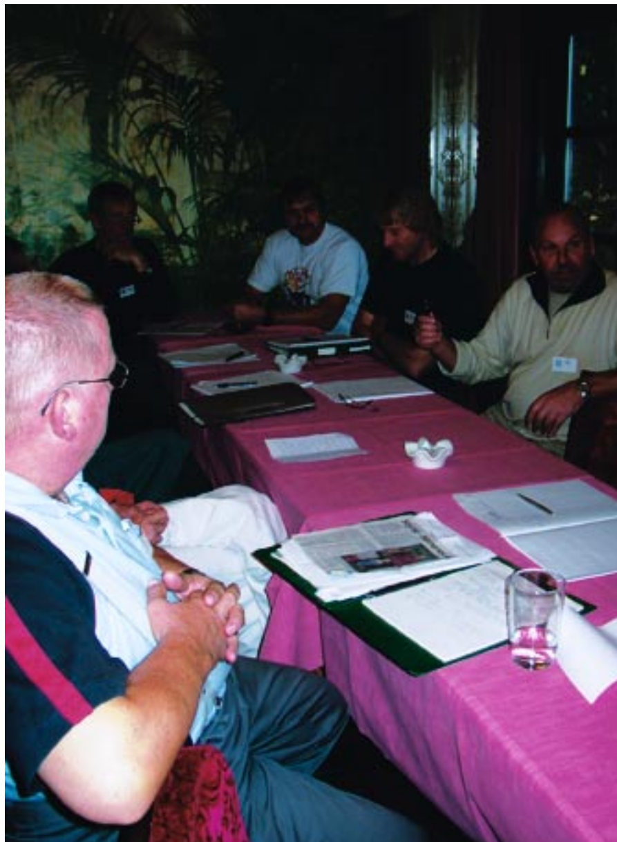
Repræsentanter fra 22 øer diskuterede i grupper øernes værdier, muligheder, og strategier for udvikling

Blandt de opgaver, der blev diskuteret, at man kunne løse lokalt var: Hjemmehjælp, havn, færgedrift, snerydning, vedligeholdelse af veje og offentlige bygninger, undervisning, børnepasning, og bopælspligt. Som sagt, så var der ikke enighed, men til gengæld kunne man blive enig om at tunge sociale problemer ikke er noget, man kan løse lokalt.