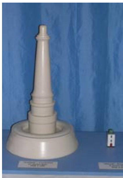
Modeller af fyrtårnenes „David og Goliath“ udstillet i Baagø Fyr