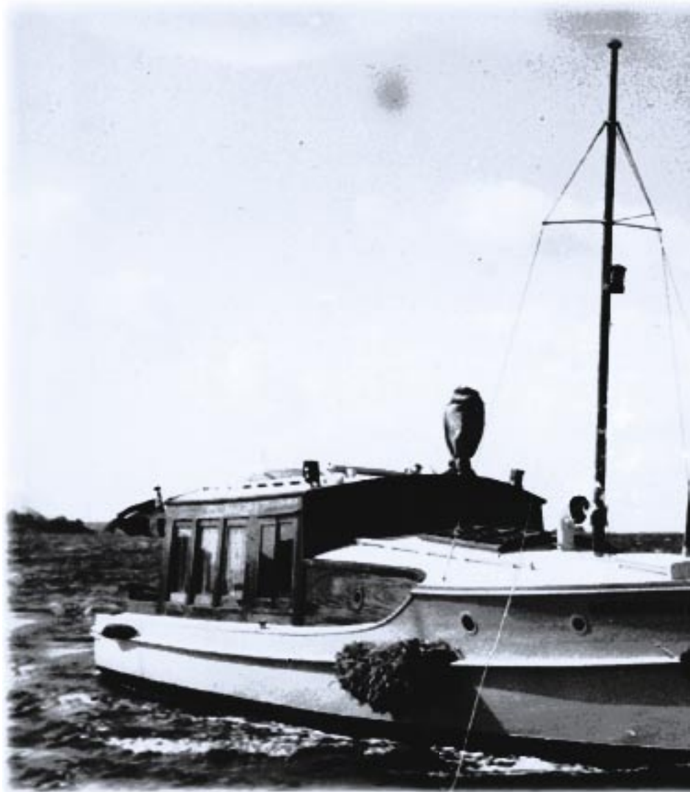
Litteratur med udrykning i Øhavet

Båden medbragte fra en start 500 bøger, men da båden havde rundet Birkholm som første stop, var der allerede udlånt 165 bind, selv om man havde rationeret antallet af bind til hver familie. Så godt som alle øens beboere var mødt op for at modtage bogbåden, da den ankom. De fleste havde kurve, andre havde net, en enkelt en trillebør og en anden en sildekasse til at bære bøgerne hjem i. Med på båden var bibliotekarer fra Svendborg og bibliotekaren ved Landet Bibliotek på Tåsinge. Sidstnævnte tjente til livets ophold som dyrlæge, hvilket øboerne ikke var sene til at benytte sig af, nu han var på øen. Gratis dyrlægeråd er ikke at foragte! Med den reducerede bogbestand stævnedes bogbåden så mod Hjortø. Her kunne man glæde en kone med