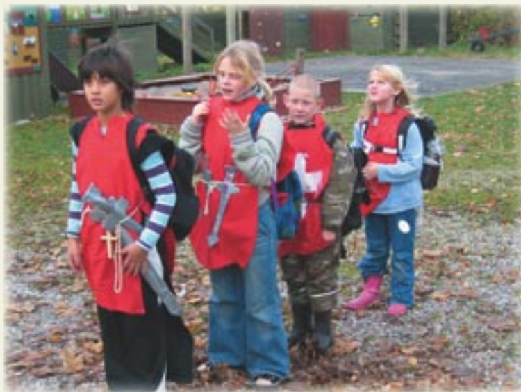
Sejt via moderne internetforbindelse at leve sig ind i middelalderen sammen med andre ø-skoleelever

Ud over selve indvielsen med Ærkebiskoppens besøg måtte adskillige klosterbeboere efter ordre fra Valdemar Sejr i korstog mod Estland, hvor Dannebrog selvfølgelig faldt ned fra himlen, og