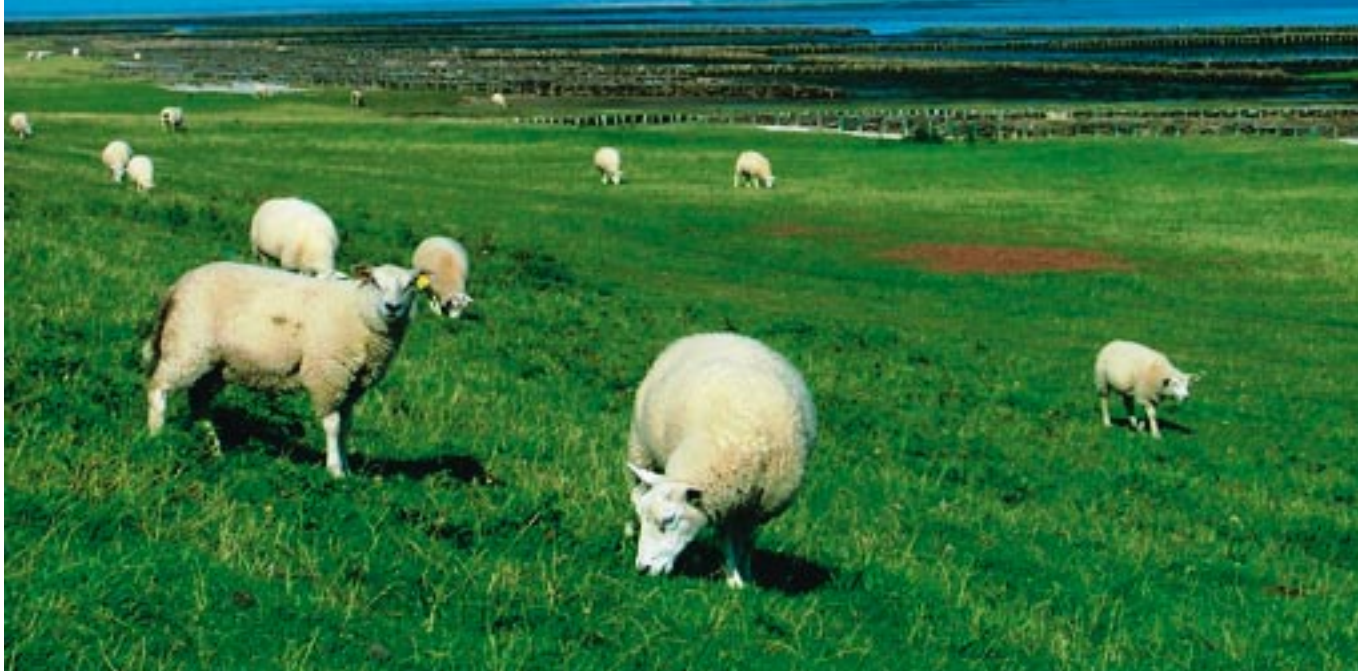
Fårehold, som her i det smukke marskland på Mandø, er en af mulighederne for ø-landmanden

13 fåreholdere fra småøerne deltog i begyndelsen af november i et to-dages kursus på Bygholm Landbrugsskole arrangeret af Småøernes LEADER+.