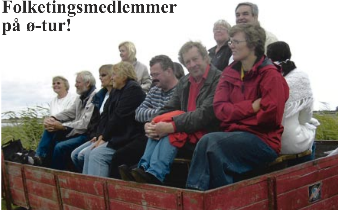
Heldigvis holdt det lunefulde sommervejr sig lidt i skindet, da Folketinget besøgte øerne. Her i åben traktor-karet på Baagø

Der stod ingen skudsikre limousiner klar, da seks medlemmer af Folketingets Ø-kontaktudvalg besøgte Baagø og Lyø. Derimod bød øerne på gæstfrihed, traktor-taxi, skrøner og en god debat om aktuelle problemstillinger på øerne