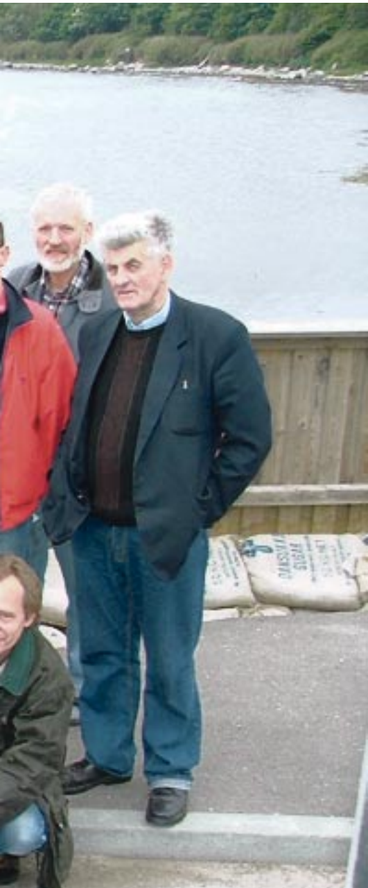
ESIN-projektet, Inter-Island Exchange-project er bl.a. finansieret af EU's Interreg III C-program samt af Skov- og Naturstyrelsen

vist sig, at budskabet om at øerne har spændende varer at tilbyde møder masser af lydhørhed. I hvert fald har netværkets aktiviteter haft en så massiv medieinteresse, at man er blevet helt forpustet.