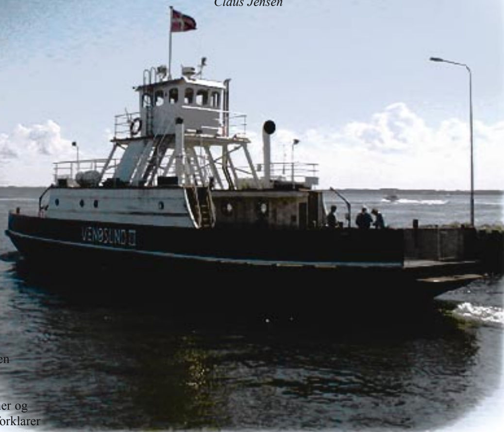
Den lille solide Venø-færge sørger for den hurtige forbindelse til fastlandet til glæde for både skolebørn, pendlere og turister

„Selvom vi er flyttet nogle gange, troede vi, at vi skulle bo i Skæring resten af vores liv“, fortæller hun.