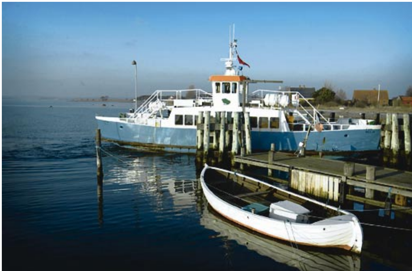
Den lille færge til Hjarnø betjener over 100.000 passagerer om året. Efter den nye beslutning fra EU-kommissionen er det ikke længere påkrævet, at færge-servicen skal sendes i licitation