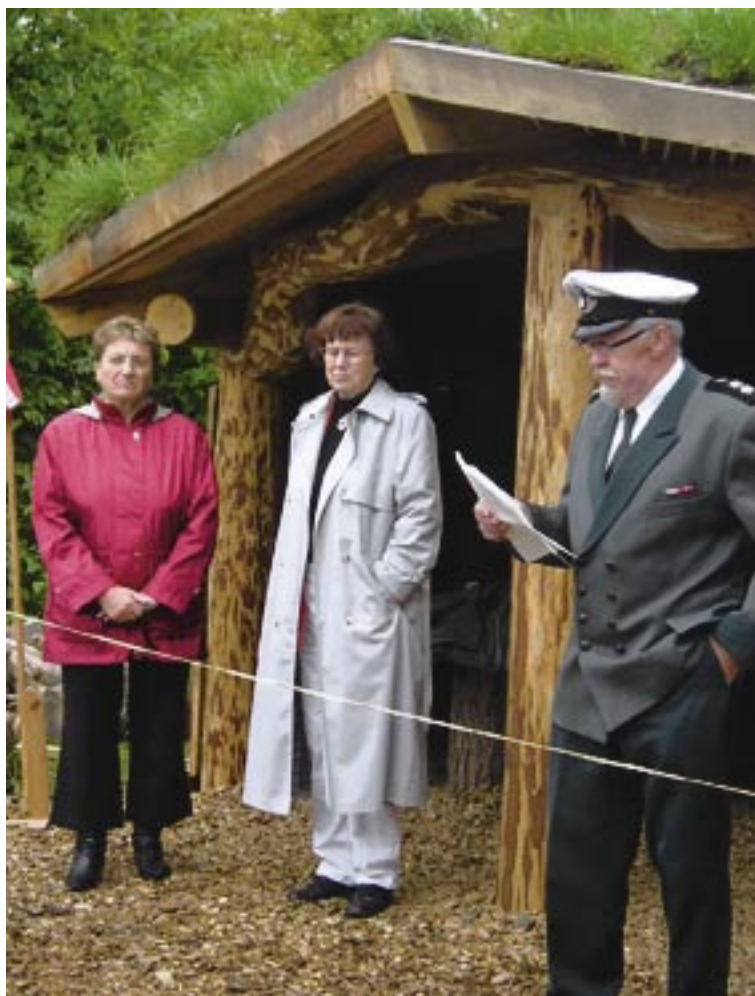
„Indvielsen af Aarø Naturlegeplads blev foretaget efter alle kunstens regler med taler og hornmusik“