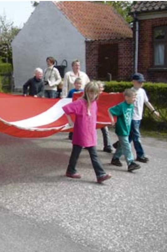
Strynø-børnene sig af traditionerne og bærer flaget til