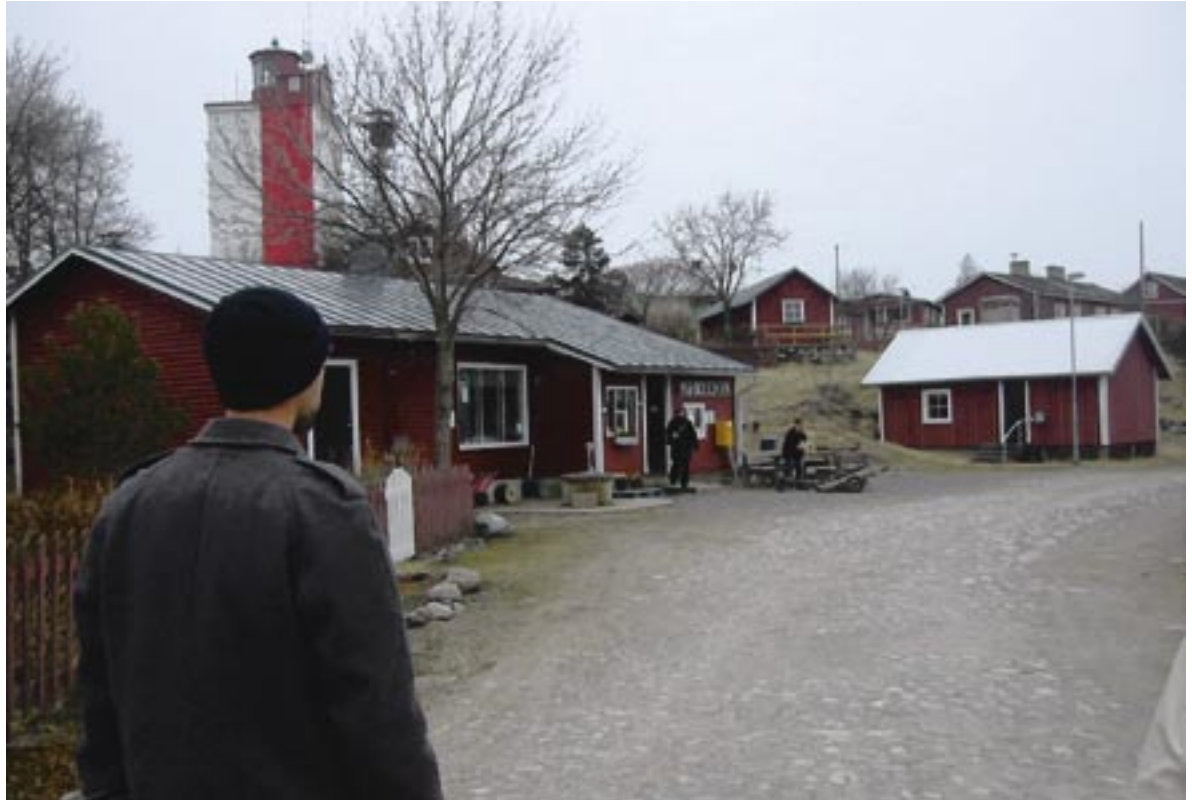
På den finske ø, Utö, er hovedparten af de ca. 50 fastboende beskæftiget ved militærbasen. Udfordringen er at fastholde en bosætning, når militæret i nær fremtid afvikler sine anlæg